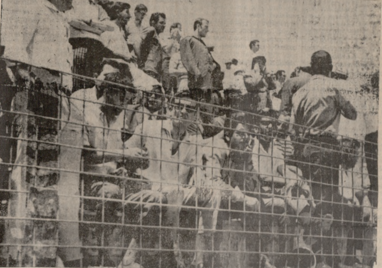
Παρά τήν ζέστη οι πιστοί φίλαθλοι τού ΟΦΗ έδωσαν και πάλι τό «παρόν» στόν αγώνα πρós τήν Λεμεσό.