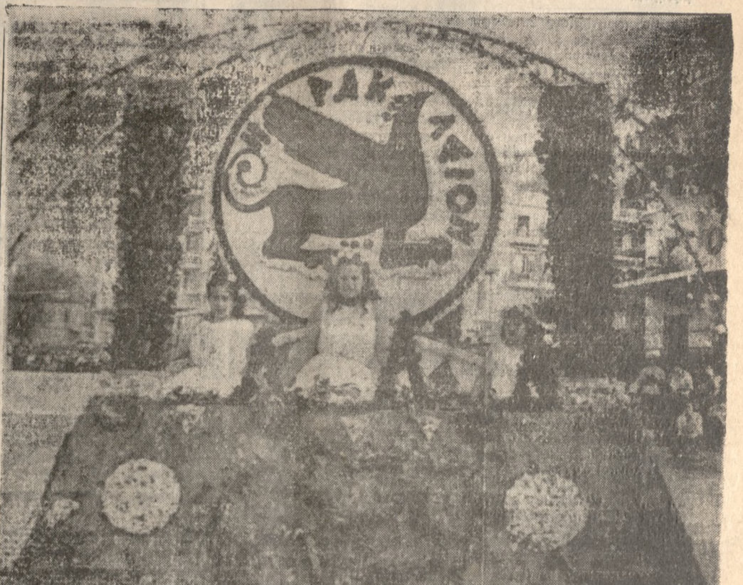
Τό όρμα τού Δήμου μέ τόν Γρύπα, σήμα τής πόλεως επίβλητικό κλείνει τήν παρέλαση τών άρμάτων.

Ότοι κατάλευσαν εις τό ξενόδοχόν «ΑΤΛΑΝΤΙΣ».