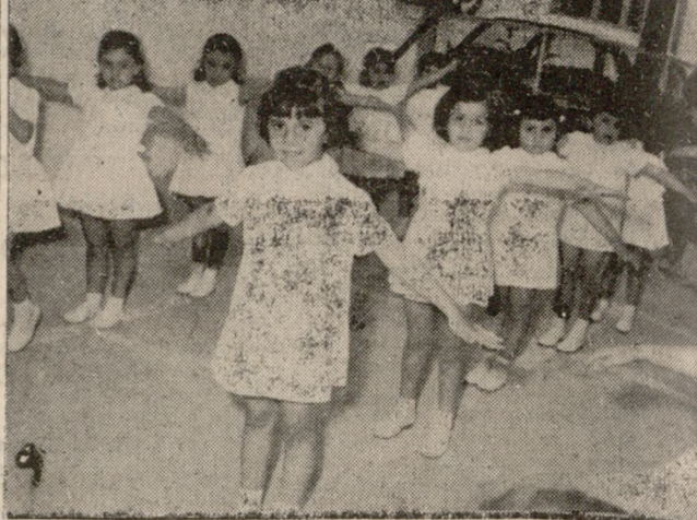
Στιγμιότυπον από τὰς Γυμναστικὰς έπιδείξεις τού 8ου Δημοτικού Σχολείου πού έγιναν προχθές τὸ απόγευμα.