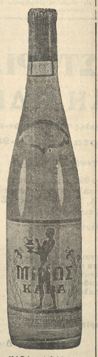
ΚΑΒΑ "ΜΙΝΩΣ" 'Ανετίρας ελάσεως πολεμικού.