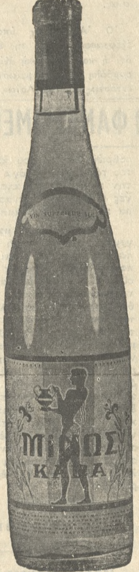
ΚΑΒΑ "ΜΙΝΟΣ" Ἀναγέραις ἐλάσεως παλῆς