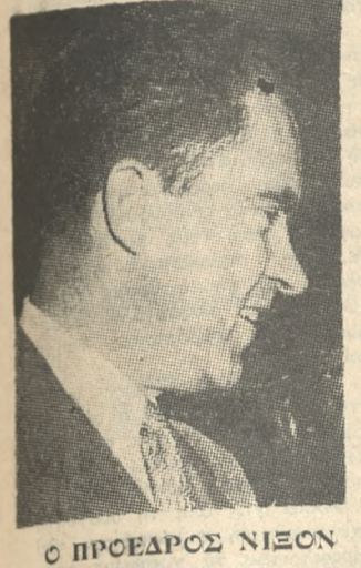
Ο ΠΡΟΕΔΡΟΣ ΝΙΞΟΝ

ΑΘΗΝΑΙ 3.— ΟΙ ΚΑΛΩΣ πληροφορημένοι κύκλοι τής Ούάσις κτών λέγουσ, ότι ο πρόεδρος Νίξον αναμένει όπωσ εντός τών μερικών ήμερών η Σοβιετική Έπιτροπή απάντησιν ευνοϊκά είς τήν προσφοράν υφιστάμενων διμερών διαπραγματεύσεων πούσ όσον τών στρατηγικών πυρηνικών όπλων.