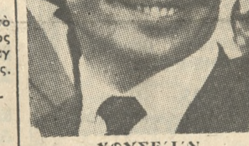
ΧΟΥΣΕΪΝ ΤΟΥ ΔΕΒΙΒΑΣΘΩΝ ΜΗΝΥΜΑ ΤΗΣ ΜΕΓΙΕΡ

ΤΟΥΤΟ άπεκαλύθη είς Νέαν Υόρκην υπό τού κ. Σόρνερον εκ τών συμβούλων τού προέδρου Τζών Κένεντυ ο όποιος ειπεν ότι διεβίβασεν ο ίδιος τού μήνυμα τής Ιορδανικής πρωθυπουργού προς τόν Ιορδανόν μονάρχην κατά τήν περιόδιον τού είς διαφόρου χώρας τής Μέσης Άνατολής.