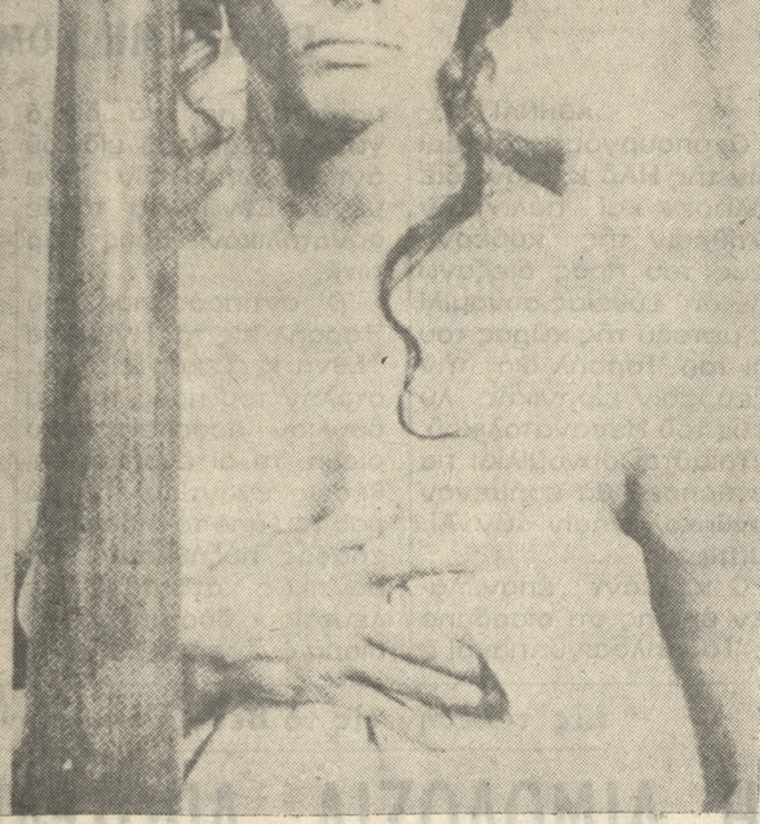
Κάποτε στη Δύση: Γιά τό πρώτο άμερικανικό γουέστερν του Ίταλου Σέρτζιο Λεόνε μία διεθνής διασημή: Τσάρλσ Μπρόνσον, Χένρυ Φόντα και ή γοπητευτική Ί. Τελίδια στήρ Κλαούντια Καρντινάλε (άνω).

Τα, Τσάρλσ Μπρόνσον. Τό άληθινό πρόσωπο του θρυλικού Φαρ Ουέστ ζωντανεμένο όπως πραγματικά ήταν, σκληρό, άδυσώπητο, θρωλικό, κι όχι όπως μάσ το γνήριος Τζών Γουαίρν. Γιά την έρμηνεία του γερασμένου σερίφη, που δροθιά ένα κορίτσι να βοηθούσ δολοφόνος, των γονιών του, θεωρείται άπό τώρα ύποψήφιος Όσκαρ.