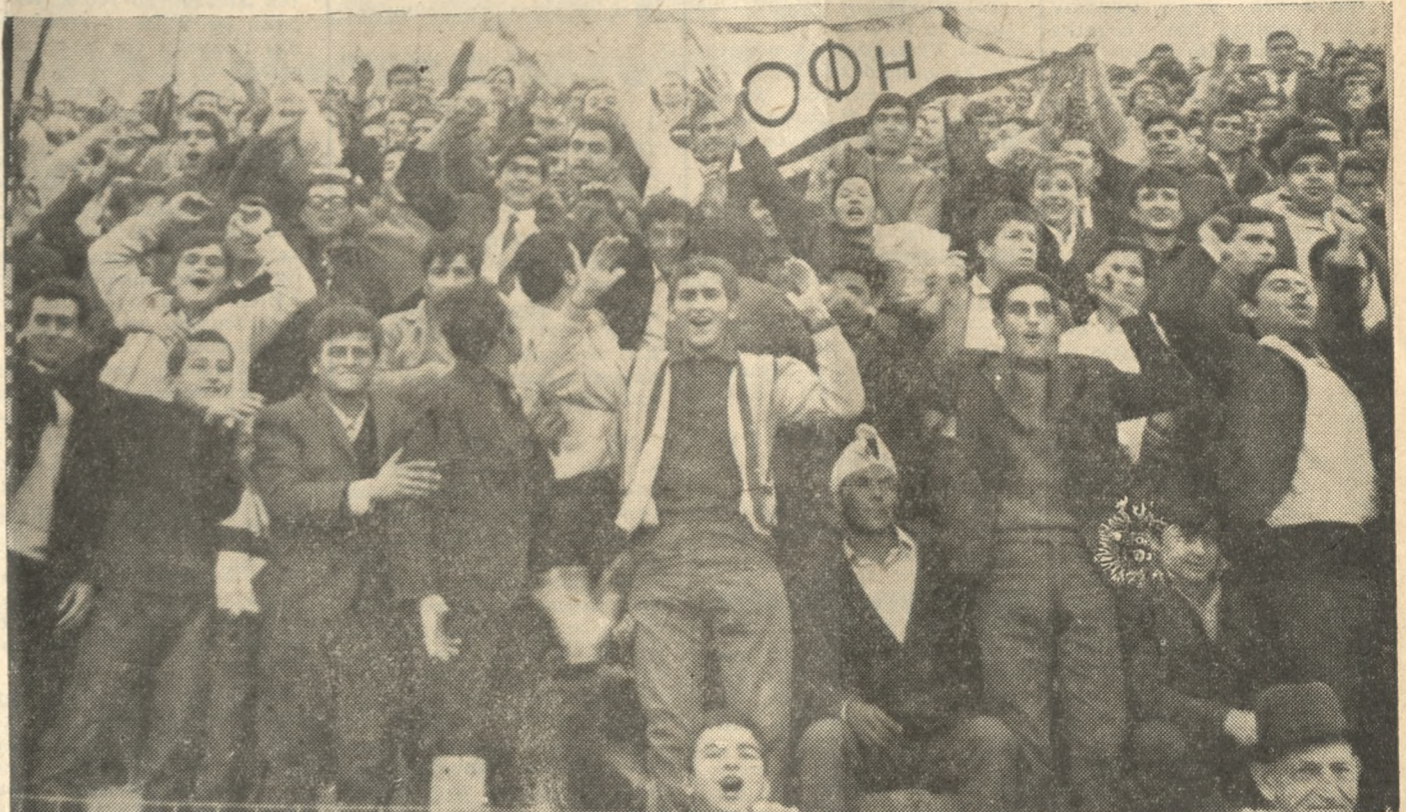
Συμπαροσάται, κατά τόν καλύτερον τρόπον, οι φιλάθλοι του ΟΦΗ έδωσαν ένα ζωντανό 'παρόν' και συνέτειναν τά μέγιστα εις την ιστορικήν νίκην της αγαπημένης των ομάδος.

Εις τό 73' ο Πλέσσα εκτύπησε εν ψυχρώ τόν Μπαλ