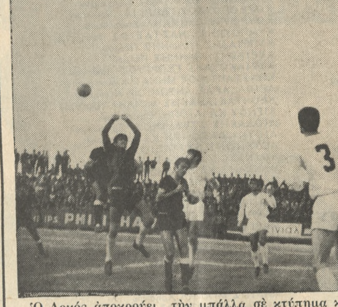
Ο Δοκός άποκρούει τήν μπάλλα σέ κτύπημα κόρνερ του Κιουσέντελης

Η ΚΡΙΤΙΚΗ Ο ΟΦΗ τήν Κυριακή παρουσίασε... δύο ομάδες. Μία εις τόν ά' ημίχρονον και μία εις τήν επανάληψιν. Η μία όμως δέν είχε καμμίαν σχέση με τήν άλλη. Η μία — τού ά' ημίχρονου — ήτο οια τής άλλης, ή οποία υπήρξεν όμως ή διαίτητής δέν έδωσε πέναλτυ εις τόν ά' ημίχρονον.