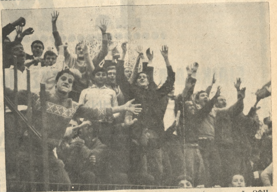
Οι φίλαθλοι πανηγυρίζουν μετά την επίτευξιν του τρίτου τέρματος του ΟΦΗ.

'Εκθρική διά τόν ΟΦΗ ή διαίτησια του κ. Μουσχάτου