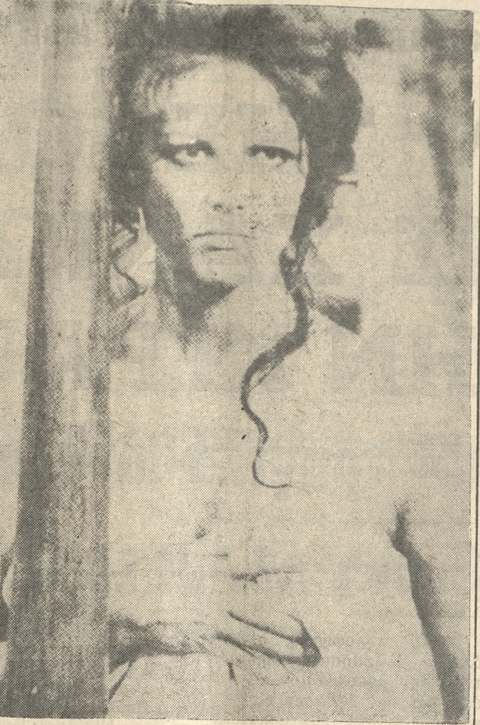
«ΚΑΠΟΤΕ ΣΤΗ ΔΥΣΗ»: Γιά τό πρώτο 'Αμερικανικό γουέστערν...