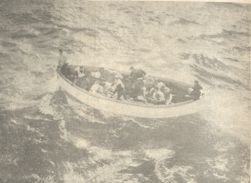
Κλεισαν χθὲς τρεῖς χροῖνα ἀπὸ τοῦ τραγικοῦ ναυαγίου τοῦ ὀχηματοποιοῦ «Ἡράκλειον». Στὴ φωτογραφία ἐνα σιμυιότατο ἀπὸ τῆς φοβερῆς ἐκείνῃ μέρα τῆς ἀναζητήσεως τῶν ναυαγῶν τῶν ἀπεραντοσίνου τοῦ ἀργεμένου βελάνου.