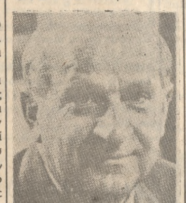
Ο άφίχθεις χθές άμερικανός πρεσβευτής κ. ΧΕΝΡΥ ΤΑΣΚΑ

ρον. Κατά τήν ένταύθα ήπτεϊαν μου πρόθεσις μου είναι νά έποκεφθώ όσον