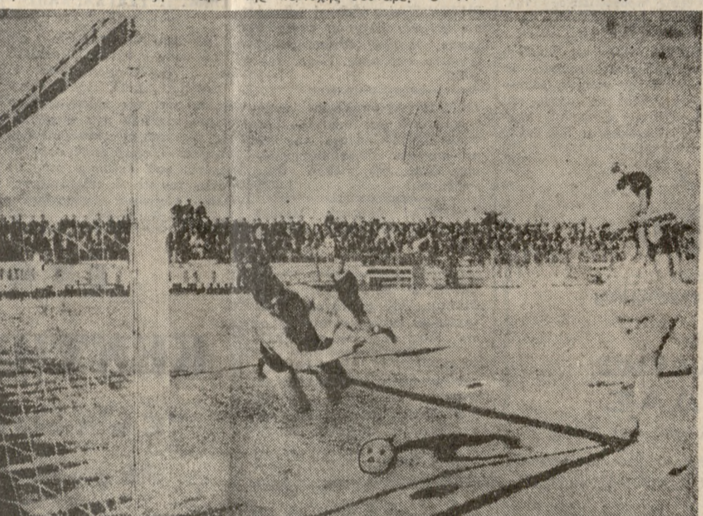
Με ύπερέντασιν ο Δινόπο υλος άποκρούει τήν μπάλλα μετά από κεφαλή τού μη διακρινομένου Λειονή (2ον Λεπτόν)

Αεροπορική τραγωδία είς τόν Άγιον Δομινικόν ΛΟΝΔΙΝΟΝ 16.— Έκφορτόντα φθόβι οί 102 άνομα έφενεύθησαν όταν άεροσκάφος πής δημοκρατίας τού "Αγιου Δομινίκου συναντήθη είς τήν Καραϊβικήν, ολίγον μετά από τήν άπογειώσιν του από τόν Σάντο Ντομίνγκο με προορισμό, τόν Πόρτο Ρίξο.