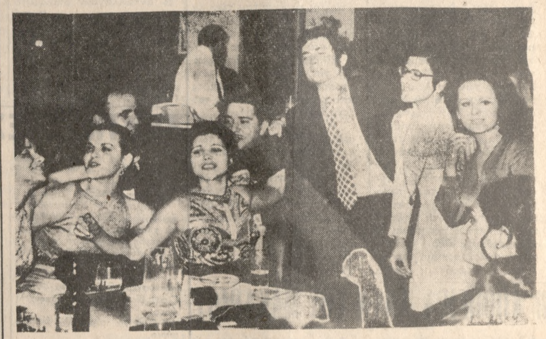
Τά Νεϊτάα διασκεδάζουν