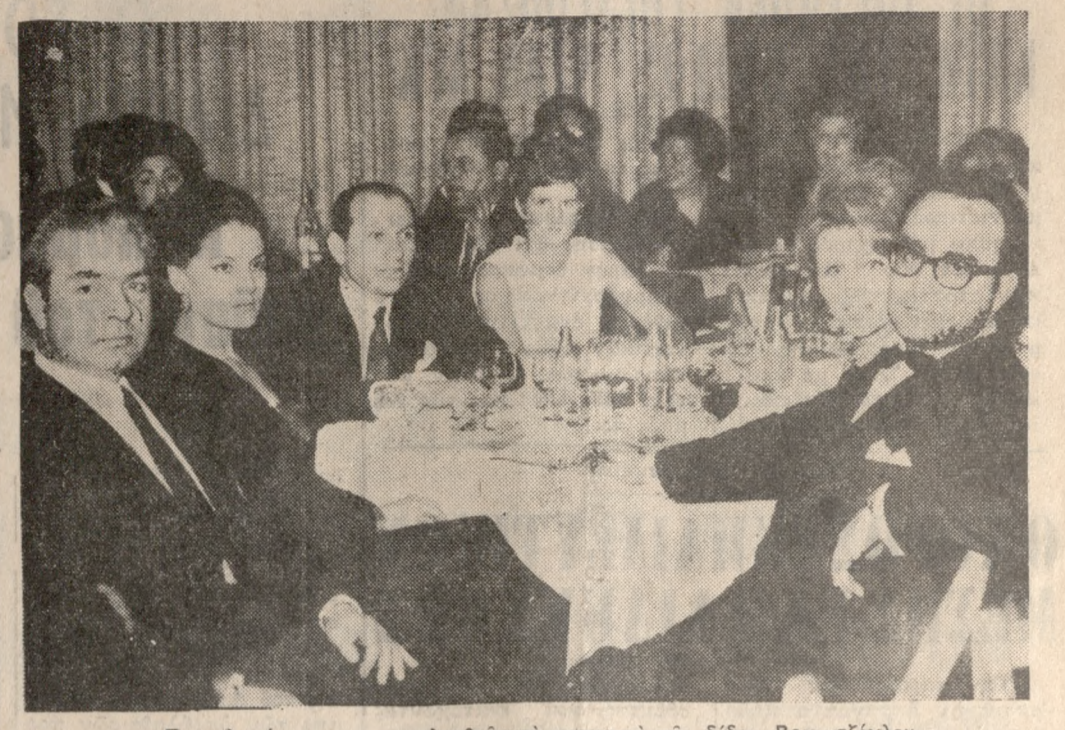
Προσηλωμένοι παρακολουθούν τήν χορευτική τής διδος Βογιατζόγλου.