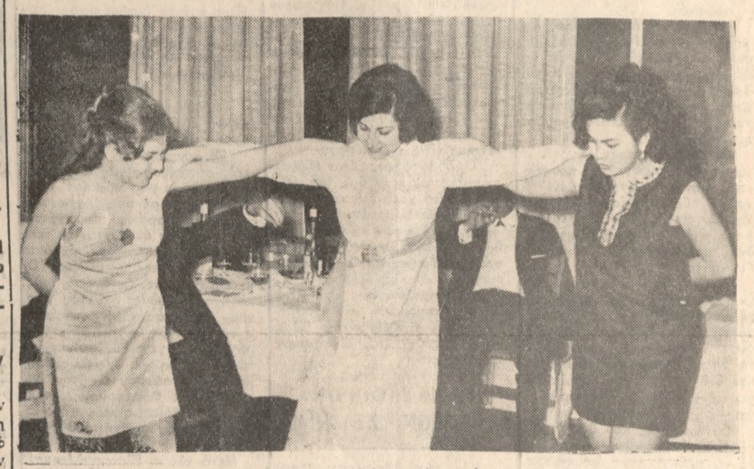
Τό άραιο φύλ ο συμμετέχει στο χοσάπτικο.