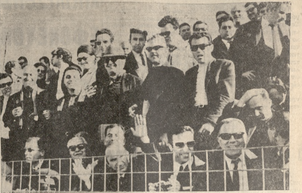
Πριν από τον άγώνα τό πρόσωπα ήσαν χαρούμενα και γελαστά. ‘Οταν, όμως, πληλοάζε προς την λήξιν του τό σκέπασε ή κατήφεια.