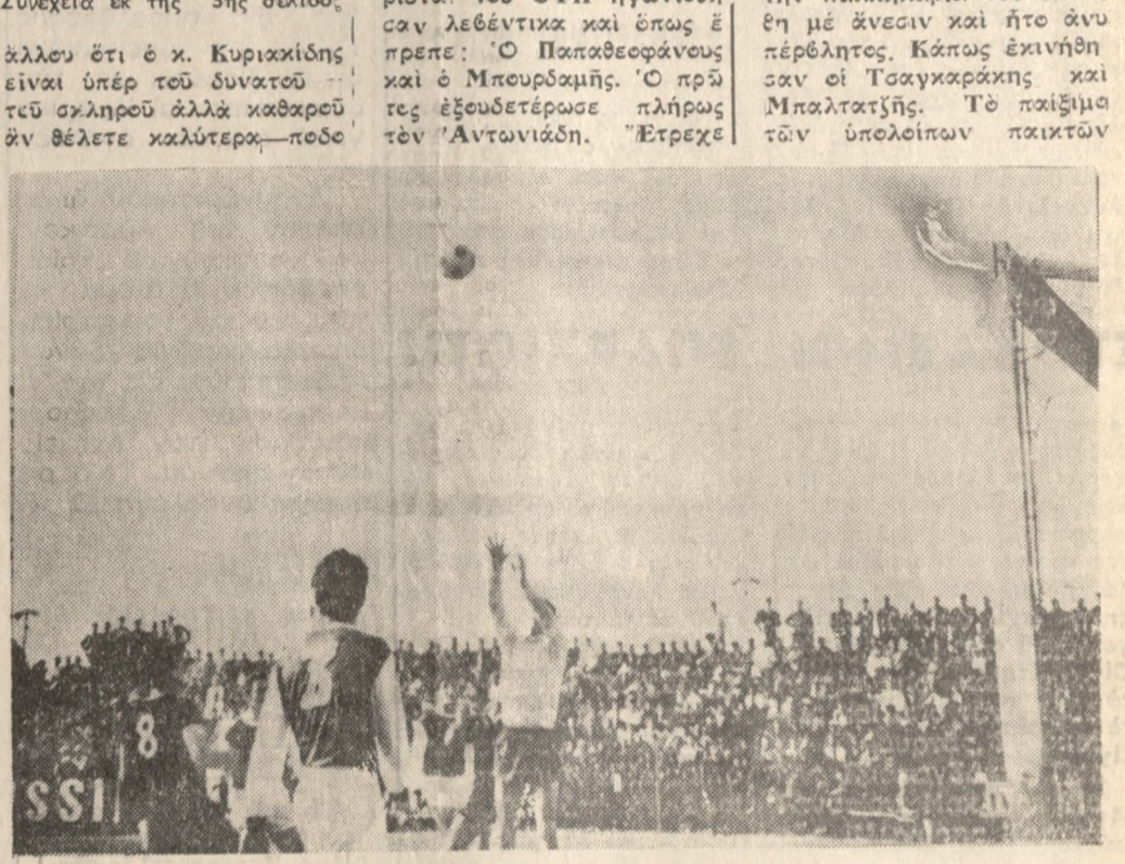
Ο Οικονομολόγος έτοιμάζεται να άποκροϋση την μπάλλα, μετά από κόρ νερ τό όποιον έχει κτυπηθί άπό τον Κιουσέντερλν.

σφίρου. Ούτε αυτό, όμως, δέν άντέχει εις κριτικήν. ‘Ο διατητής κ. Κυριακί δης ήγήνησαν καταφανές πένκαυ εις έθρος του Πα