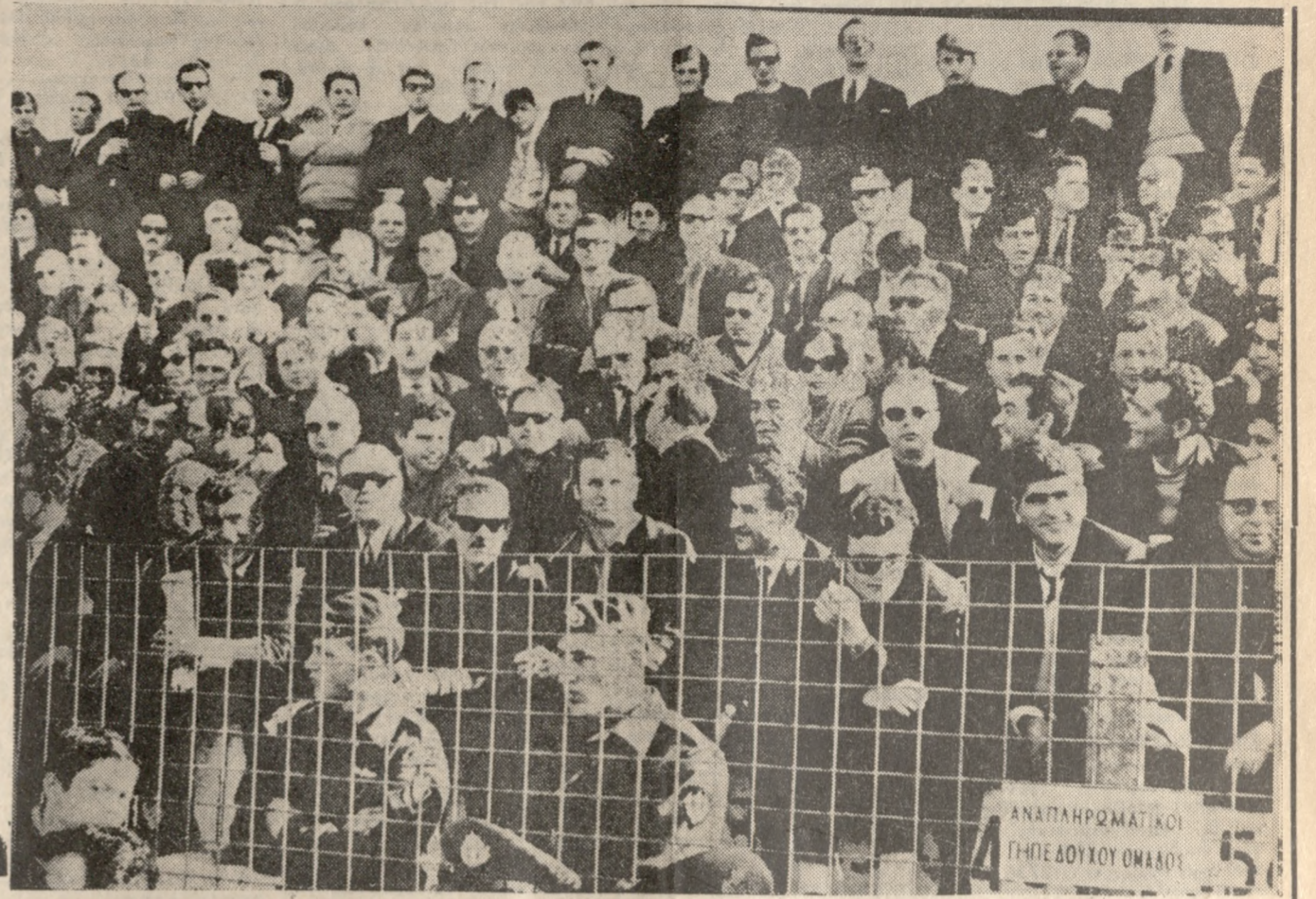
Με τ' ύψειον ύπομονήν οι φίλαθλοι άναμένουν τήν έναρξην του μεγάλου άγώνος. Μετά από λίγο θα φύγουν δυαρεστημένοι. Και να σκεφθί κανείς ότι οι περισσότεροι από αυτούς άνέμεναν ΠΕΝΤΕ! (5) ώρες τήν έναρξην του άγώνος υπό καυτόν ήλιο.

82': Ο Σούρης άποκρούσε τήν μπάλλα με τό