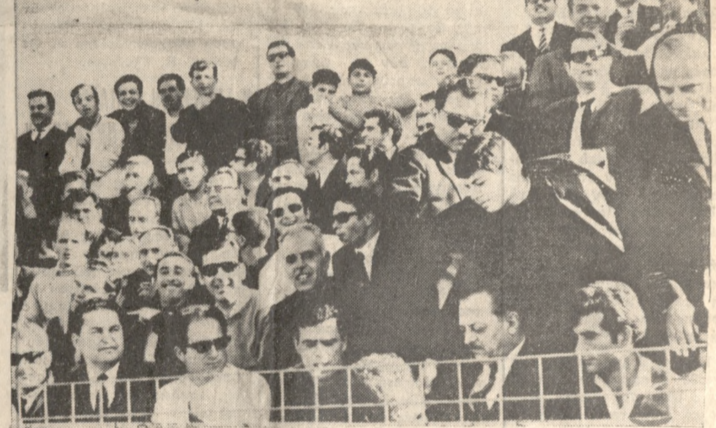
‘Από πολύ νωρίς οι φιλαθλοι είχαν πάρει θέσιν εις την κερκίδα. Τό μάτς πα ρουσίαζε μεγάλο ένδιαφέρον και δέν έπρεπε να τό χάσω.

σφίρου. Ούτε αυτό, όμως, δέν άντέχει εις κριτικήν. ‘Ο διατητής κ. Κυριακί δης ήγήνησαν καταφανές πένκαυ εις έθρος του Πα