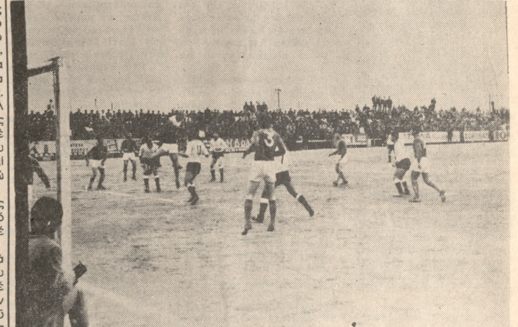
Φάσις άπο τον «ιστορικόν» άγώνα ΟΦΗ — ΠΑΝΙΩΝΙΟΥ