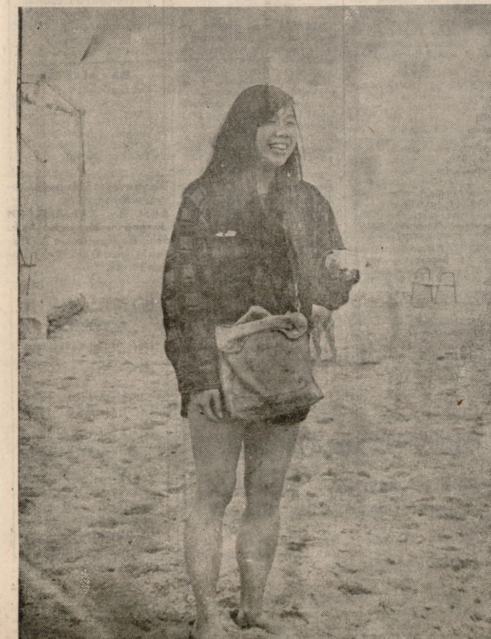
Και η ΑΠΘ ΑΝΑΤΟΛΗ έχει στείλει την αντιπρόσωπόν της για το συνέδριο.

Το Μάταλα. Θέμα που συγκεντρώνει το διεθνές ενδιαφέρον τον τελευταίο καιρό, και που το ενδιαφέρον αυτό αυξάνει και διαρκώς, είναι η πραγματοποίηση του Συνεδρίου των «Χίππυς» στον ήμερο εκείνο όρμο.