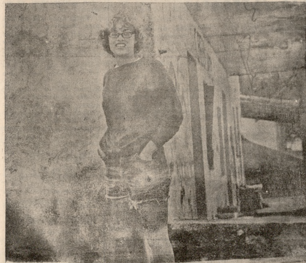
Γελαστή μπροστά στο φακό της «ΠΑΤΡΙΔΟΣ».