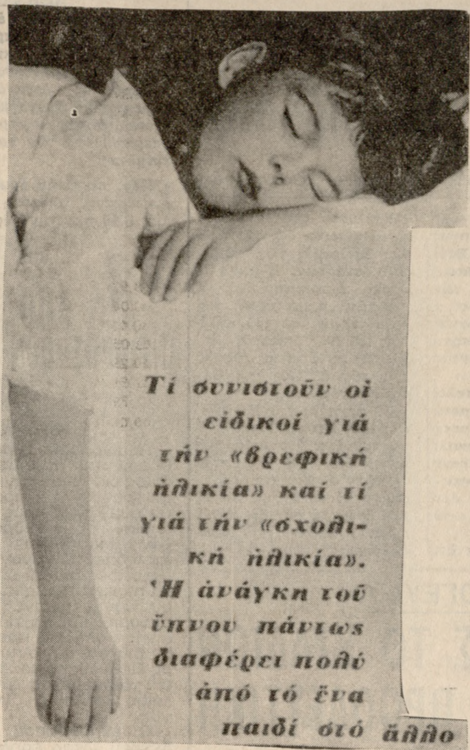
Τι συνιστούν οι ειδικοί για την «βρεφική ηλικία» και τι για την «εφηβική ηλικία». Η ανάγκη του ύπνου πάντως διαφέρει πολύ από το ένα παιδί στο άλλο.

Το πρόβλημα της ώρας που ύπνεται να κοιμούνται τα παιδιά άσχετα τις μητέρες έλου του κόσμου και όλων των εποχών.