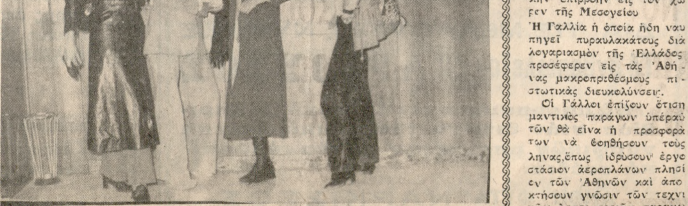
Τόσπερα από τή έξ άραιότατα μανειών τού Οίκου λόγου Μπουσσάκ εμπρός στό φοιτηκό τού «ΑΣΤΟΡΙΑ». Μάξι και παινατόνια θα λάραουν σήμερα στίς 8 μ.μ. από τήν πασαρέλα τού «ΑΣΤΟΡΙΑ». Προσλήψεις διαστρέφονται από τήν ύποσημοποιείαν τού κ. Ν. Φανουράκη που άνηκεί τήν Αθλητικήν Έταιρείαν τού Ο.Π.Σ.Σ.Α.Κ.