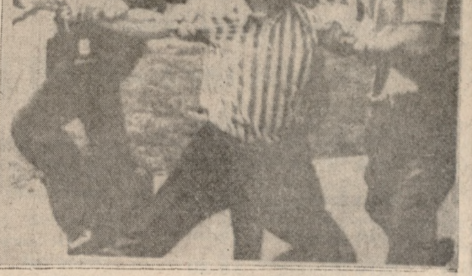
Αμερικανοί διαπληκτιζόμενοι με τους άστυνομικούς κατά την διάσκεψιν εκδηλώσαν έναντίον της απόφασης Νίσον...