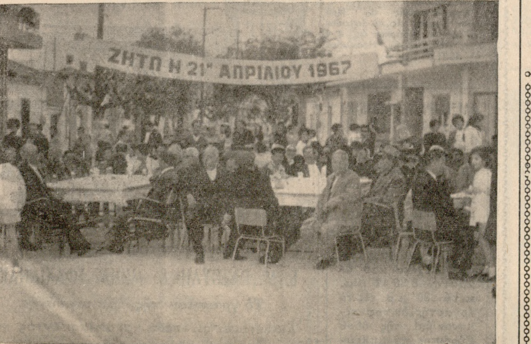
Μία άπόψεις από τού γλέντι τού όποιον έλαβε χώραν τού έσπεράς τής προχθές Κυριακής εις τόν συναϊκισμιόν Ν. Κλαζμενών

Τιμάς πρὸ τού ναού άπέδωσαν η Δημοτική Φιλαρμονική και τμήματα μαθητών τής ΣΕΑΠ, ομηνιδών τής 126 ΣΑΒ, ναυτών τού Κεντρικού Λιμεναρχείου ο και έμάς προσκόπων. Μετά τούτα και περί ώραν 12ην μεσημεριανήν έλα