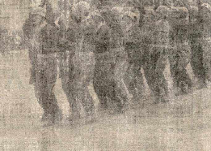
Η διμοιρία έπίδειξεν τής ΣΕΑΠ ενώ εκτελεί θεαματική άσκήσιν κατά τόν εορτασμιόν εις τού 'Εθνικόν Γυμναστήριον