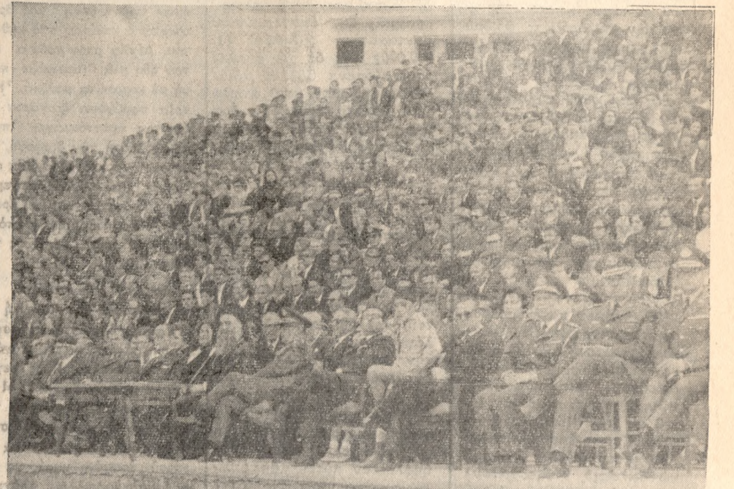
Κατάμεστον κόσμος ήτο προχθές τού 'Εθνικόν Γυμναστήριον, κατά τας εορταστικάς εκδηλώσεις τής ΣΕΑΠ. 'Ανωτέρω οι έπίσημοι (πρώτη σειρά) και ένα μέρος από τούς θεατάς.

'Υπό τόν ΕΠΣΗ εκλήθησαν εις τήν Μικτήν 'Ηρακλείου οι κάτωθι ποδοσφαιρισταί: ΕΡΓΟΤΕΛΟΥΣ: Πολυχρονάκης Μαρμάκης, Σπαιουδάκης, Βαρδαλαχάκης, Κοντοκώστας, Ζεβελάκης, 'Αποστολάκης, Βραχασσοτάκης, Παχιουδάκης, Σαντιζής και Μοσιράλης. ΠΟΑ: 'Ακουμιανάκης, Γεώργ. Γιαλαμάς, Σταμ. Σπέγγας, Γεωργίου, Κανταλής και 'Ατζαμίδάκης. ΕΓΟΗ: Βαρούχας, Ζαγαλάκης, Παπαδάκης, Μιχαλίτης, Μελαχροινός, Στρατάκης και Μοιράλης. ΠΟΣΕΙΔΩΝΟΣ: Γιαλαμάς 'Ι., Βελιγραδής, 'Αποστολάκης Εύάγγελος και Δρακωνάκης. ΗΡΑΚΛΕΟΥΣ: Βερύσησος και Γαλατσιανός. ΜΙΝΩΙ'Ι ΚΗΣ: Διδόνης.