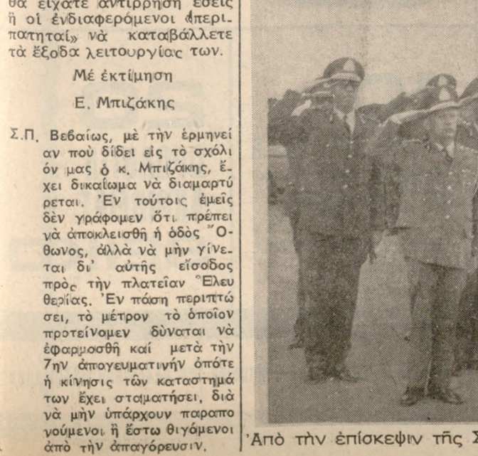
Από τήν έπίσκεψιν τής Σχολής Δοκίμων 'Υπεννομαρχών εις 'Ηρακλείον