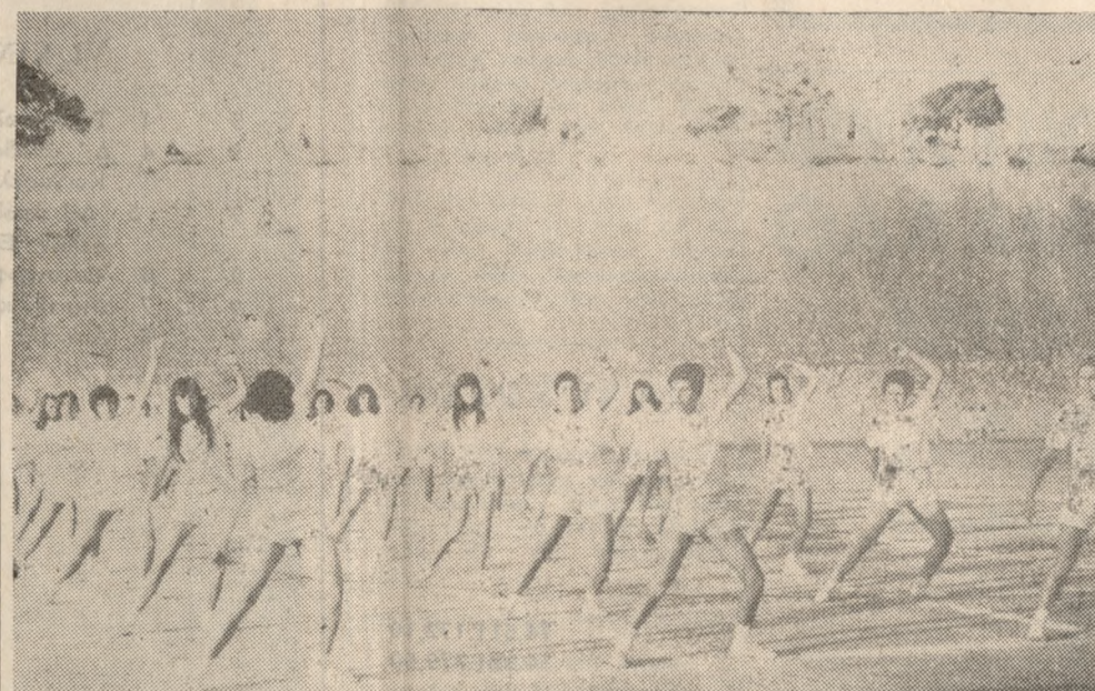
Ένα χαρακτηριστικόν στιγμιότυπον από την έκτέλεσιν άσκήσεων άκριβείας ύπό μαθητριών της Σχολής Μπουρλώτου.