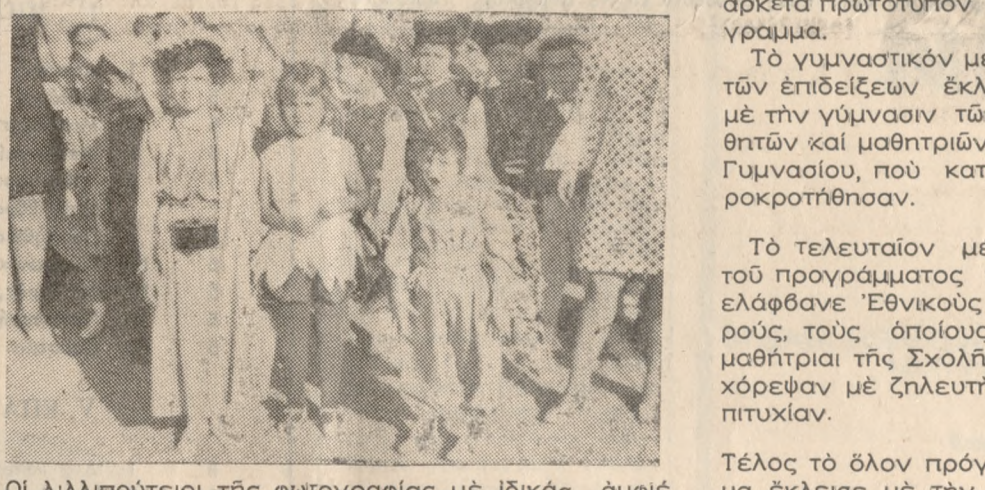
Οι λιλιπούτειοι της φωτογραφίας με ίδικας άμφοίσεις, αι όποιοι προεκάλεσαν αισθήσιν εις τους θεατάς, αναμεινον την ώραν να άνοιξουν τό πρόγραμμα των γυμναστικών επιδείξεων. Οι μικροί ένεθου οίασαν και κατεχειροκροτήθησαν.