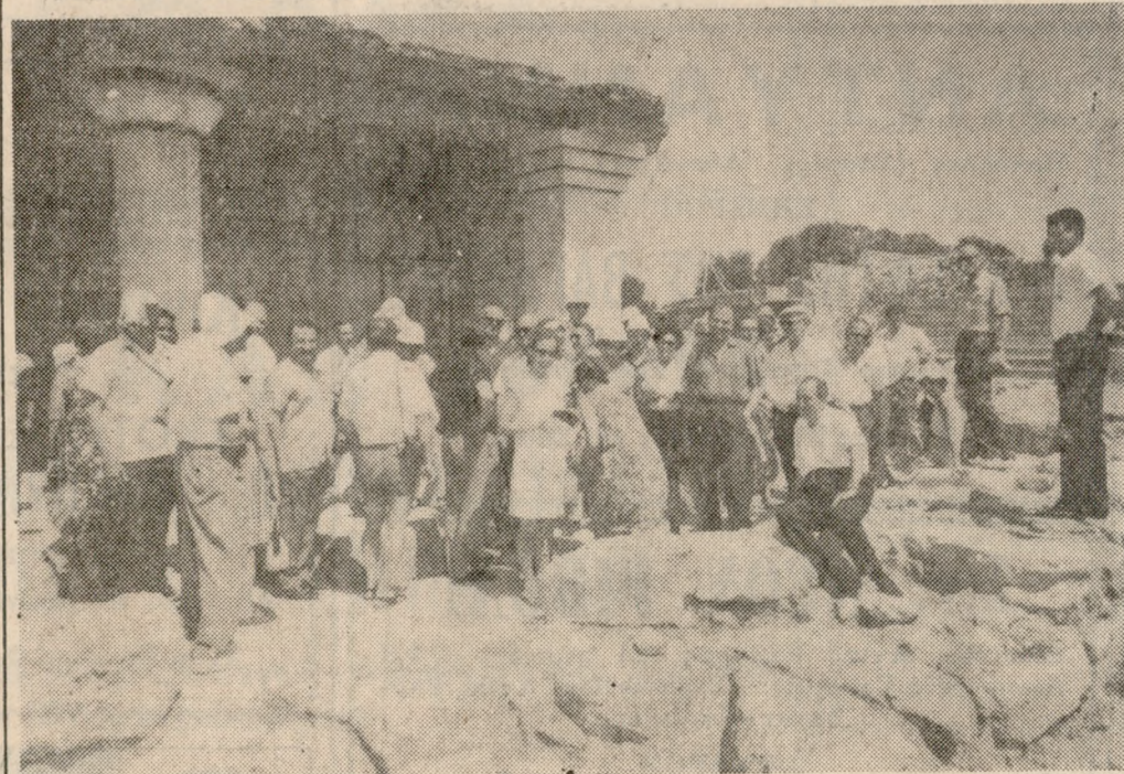
'Ασχίσθησαν χτές εις τό 'Ηρακλείον, ως είχαμεν προαναγγείλει, 80 περίπου Σύνοδοι της διεθνούς 'Ενώσεως 'Ορειβατικών 'Οργανώσεων, προκειμένου να παραστούν εις τόν Κρήτην άρξάμενον διεθνούς 'Ορειβατικού Συνέδριον. Οι Σύνοδοι μεταξύ των όποιων είναι πολλοί διακεκριμένοι και διεθνούς φήμης 'Ορειβάται, περιηγήσαντες χτές τά αξιοθέατα της πόλεως και τάς αρχαιότητες του Νομού με τό δε έσπέρως παρέστησαν εις γεύμα παρτάσθεν προς τιμήν των υπό τού Δήμου 'Ηρακλείου ό τό ξενοδοχείον 'Ατλαντίς'. 'Ανωτέρω ένα στιγμιότυπον, από την σού.