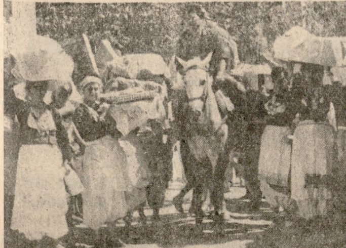
Η μεταφορά των «προυκιών». Με τό άλογο μεταφέρθηκε ή γλάστρα με τον Βασιλικό.

ΝΑ ΤΙ ΕΙΝΑΙ περίπου ή τελετή αυτή τού γάμου, πού έτι προχθές τήν Κυριακή σ' Άνωγεια: Ένα έθιμο γεμάτο από λεβεντιά, αίσθημα, χάρη, χορό, μουσική, τραγούδι, φαγοπότι, φιλότιμο, παλληκαροσύνη, κ' ό,τι άλλο μπορεί να νοιώσει ο νους και ή ψυχή τού ανθρώπου, όταν βρίσκεται: σέ έπαφή με όσα ώραία και αγαθά πρόσφερε ο Δημιουργός στά δημιουργήματά του.