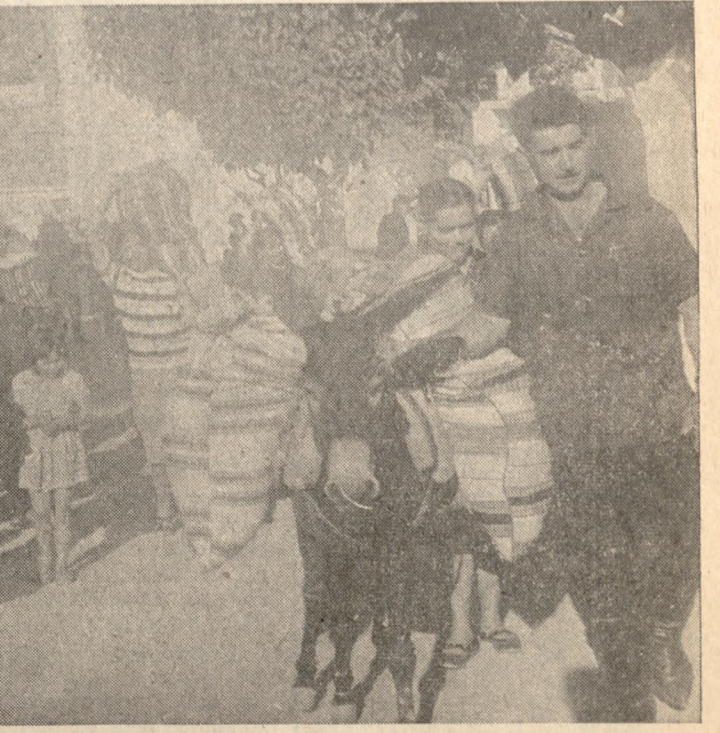
Τά περιφίμα «κανίσκια» τού Άνωγειανού Γάμου.

Μετά από πολλές παρακλήσεις πού γίνόντουσαν πιά ντα σέ μαντινάδες, τελικά ή νύφη έμεινίστηκε και παρέδεδη από τον πατέρα της στέν γαμπρό. Ήταν