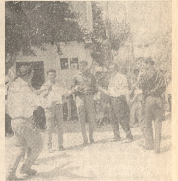
Τό γλέντι άρχισε στή πλατεία τού Περαχωριού

όπου τούς πρόσφεραν φαγητά μεζέδες και κρασί. Η άπεμπή αυτή των άνωγειανών κράτησε μέχρι τής 11. Άπό τήν ώρα αυτή και μετά άρχισε πιά πυρετώδης έτοιμασία. Οί φίλοι τού γαμπρού και οι φίλες της νύφης, άρχισαν να πηγαίνουν στά σπιτία ένός έκάστου σπιτί με τον έκαμίνι. Στο σπιτί τού γαμπρού άλλα κεράματα, άλλα τραγουδία, άλλα κέφι. Η ΣΤΕΦΑΝΩΣΗ Και κατά τής 3 μ.μ. άρχισε ή πιά ένδραφεύουσα φασις τής τελετής. Ο γαμπρός με τό σείκι τούς φίλους του, ξεκίνησε