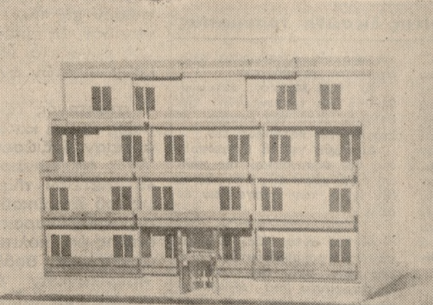
ΕΚΤΕΛΕΣΙΣ ΕΥΑΓ. ΠΑΠΑΔΑΚΗΣ ΤΗΛΕΦ. 282917