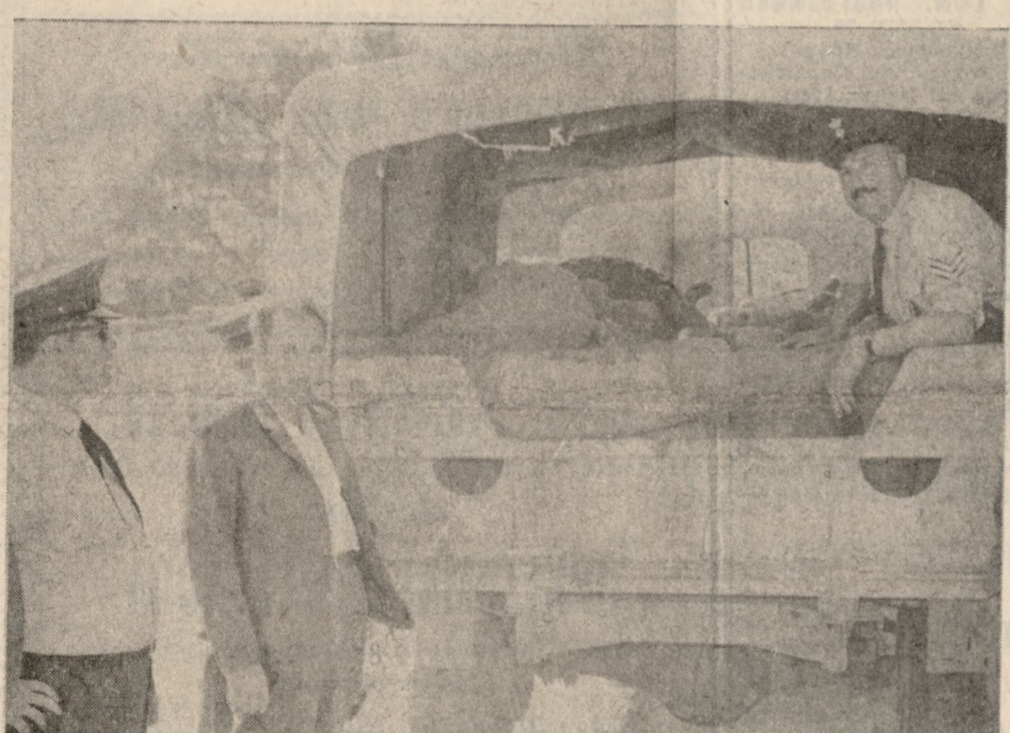
«Εμπόρευμα» αξίας έκατον έκατομμυρίων δρχ. μεταφέρουν οι άστυνομικοί έκ τού αερολιμένας μας εις Ηράκλειον.

Τό Πατριαρχικόν ευεργετικόν γράμμα θα δοθή σήμερον εις τόν τιμηθέντα υπό τού Σεβασμ. Αρχιεπισκόπου Κρήτης κ. Ευγένιου, κατά τό τέλος τής θείας Λειτουργίας εις τόν Ίερόν Ναόν τού Άγ. Μηνά.