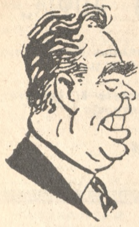
Ο κ. ΜΠΡΕΖΝΙΕΦ

Επίσης ο κ. Μπρέζνιεφ έ χαρακτηρίσεν τας προσφάτους προτάσεις των διεθνών κατά τας ειρηνευτικές συνομιλίας των Παρισίων ως λογική και δικαίαν δάσιν δι' άτον τερματισμόν του πολέμου και προσέθεσεν ότι εάν ή κυβέρνησις των Ηνωμένων Πολιτειών μελετήσεται μετά προσοχής τας προτάσεις αυτές θα καταστή δυνατή ή περαιτέρω πρόβος προς την πολιτική διευθέσιν του προβλήματος του Βιετνάμ.