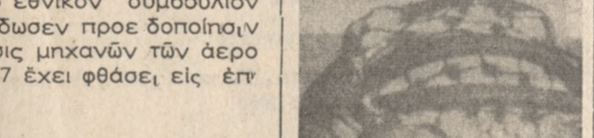
ΑΡΑΦΑΤ: Ο ήγέτης τών Παλάστίνων και πούτερ γάτος του έννεαήμερου έμφυλίου πολέμου τής Ιορδανίας.