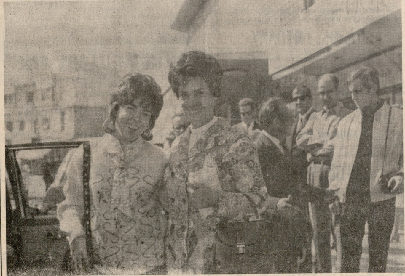
Άφικθη χθές τήν πρϊωτάν άεροπορικώς είν τήν πόλιν μας ή κ. Δέσπη Παπαδοπούλου, σύζυγος τώ προέδρου τήςκυβερνήσεως κ. Γ. Παπαδοπούλου, συνοδευομένη ύπό της θυγατρός της. Η κ. Παπαδοπούλου άνεπαύθη επ' όλίγον είν τώ ξενοδοχείον «ΑΣΤΟΡΙΑ» και έν συνεχεια άνεχώρησεν διά Ρέθυμνον, και παρρηκολούθησε γύρομα τής ταινίας «Η ΧΑΡΑΥΓΗ ΤΗΣ ΝΙΚΗΣ» της εταιρείας «Δαμοσκη νόν - Μ χαρλίδης». Η σύζυγος τώ κ. πρωθυπουργού έπέστρεψεν άργά τώ άπόγευμα είν Ηρακλείον όπου τήν 8.30 μ.μ. παρεκάθησεν είν δέιπνον παρατεθέν πρϊς τιμήν της ύπό τώ Δημάρχου κ. Βογ. ατζακη είν τώ «ΑΣΤΟΡΙΑ». Η κ. Δέσπη Γ. Παπαδοπούλου άνεχώρησεν δι' Αθήνας τήν νυκτερινήν πτήσιν τής «ΟΛΥΜΠΙΑΚΗΣ». Είν τήν φωτογραφίαν ή σύζυγος τώ κ. Πρωθυπουργού μετά της θυγατρός της.