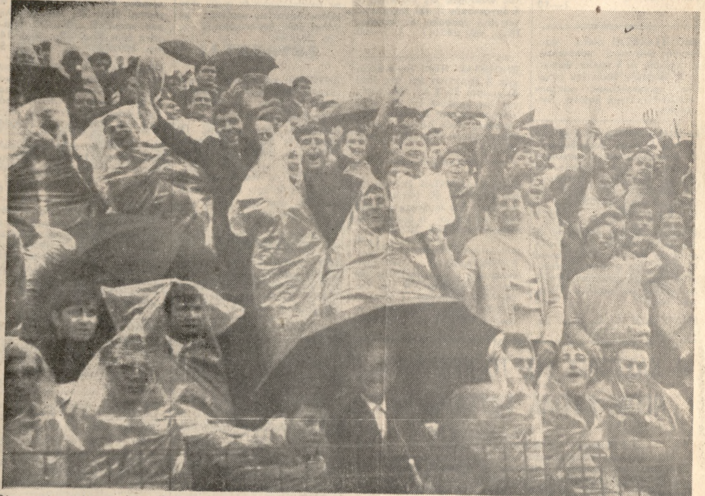
Οί πιστοί και άφοσιωμένοι φίλαθλοι του ΟΦΗ δέν λογάρισαν τήν Κυριακή ούτε τήν βροχή, ούτε τό κρύο και έδωσαν ένα έπιθετικό «παρόν», ενισχύσαντες τήν άγαπημένη τους ομάδα.