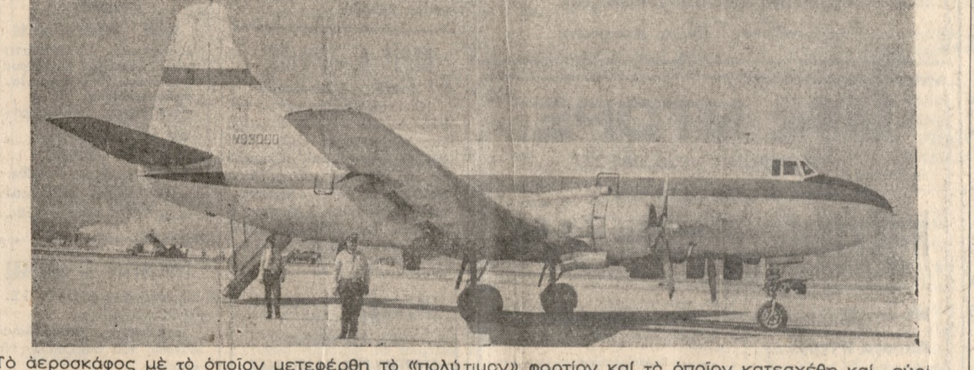
Τό αεροκάφος με τό όποιον μετεφέρθη τό (πολύτιμον) φορτίον και τό όποιον κατεσχέθη και εύρίσκειται άκόμη εις τόν αερολιμένα μας.