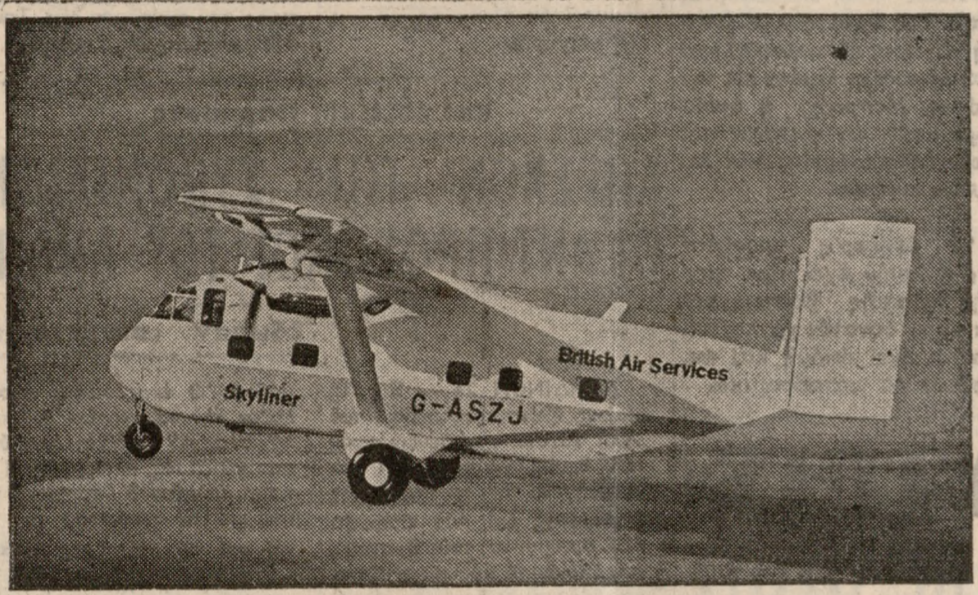
Το νέο πολυτελές επιβατικό αεροπλάνο Σκάλιτνερ, που εξειλιχθή από το μεταγωγικό Σκάδον. Τα ντυλάπια άποσκυών που είναι φιλία επάνω από τις θέσεις επιβατών, ή στερεοφωνική μουσική και ό κρο υφός φωτισμός που διαθέτει προσφέρουν ανέσεις όμοιες με των μεγάλων αεριωθούμενων.

Κτηματομεσιτικών γραφείων Ε. Μ. ΡΑΖΟΥΛΗ & ΜΗΝΑ ΣΦΑΚΙΑΝΑΚΗ Τό γραφείων τής έμπιστοσύνης Διαθέτουμε οικόπεδα και οίκιας έντός και εκτός τής πόλεως. Τετράγωνον 50 Τηλέφωνον 34-70