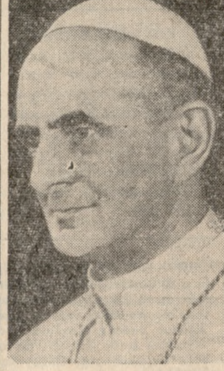
Αυτό 'Αγιότητα έχον εις την μήν χειρά ένα σταυρόν. 'Όταν έβησσε πολύ πλησίον της Αι- τούς 'Αγιότητας άναστήσε μά- χιραν και άπεπείρθη να πλή- ξη την Αιούτ 'Αγιότητα αλλά ήμποδίσθη υπό άνδρος της ά- σφαλείας του Ποντίφικος. 'Ο 'Αγιος Πατήρ δέν άντελήθη τι ακριβώς συνέβη και συνεχί- σων να χαίρηται και να μιείδι προς τους έπισημούς οι όποιοι τον ύπεβέβησαν.

Αυτό 'Αγιότητα έχον εις την μήν χειρά ένα σταυρόν. 'Όταν έβησσε πολύ πλησίον της Αι- τούς 'Αγιότητας άναστήσε μά- χιραν και άπεπείρθη να πλή- ξη την Αιούτ 'Αγιότητα αλλά ήμποδίσθη υπό άνδρος της ά- σφαλείας του Ποντίφικος. 'Ο 'Αγιος Πατήρ δέν άντελήθη τι ακριβώς συνέβη και συνεχί- σων να χαίρηται και να μιείδι προς τους έπισημούς οι όποιοι τον ύπεβέβησαν. 'Ο Πάπας έξ άλλου ενώ το αεροπλάνο το όποιον τον με- τέφερεν από το Πακιστάν εις τάς Φιλιππίνους διήρτησε ύπε- ράνω του Βιετνάμ άπέρηθεν έκκληριον προς το όρειον και το νότιον Βιετνάμ δια την άπο- κατάστασιν δικαίας ειρήνης εις όλόκληρον την χώραν. Εις το μήνυμά του προς τον πρόεδρον το όρειου Βιετνάμ ο Πάπας έξέφρασε τας θερμότητας εύ- χας του δια μίαν ειρηνικήν και διαιρητικήν ειρήνην ενώ εις το μήνυμά του προς τον πρόεδρον του νοτίου Βιετνάμ άνέφερον έπι προσευχών δια την άδελ- φήν όμοιοσιν του Βιετνάμ το όποιο τα είναι τόσον άγαπητά.