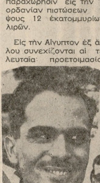
Ο Βασιλεύς τής 'Ιορδανίας Χουσεΐν