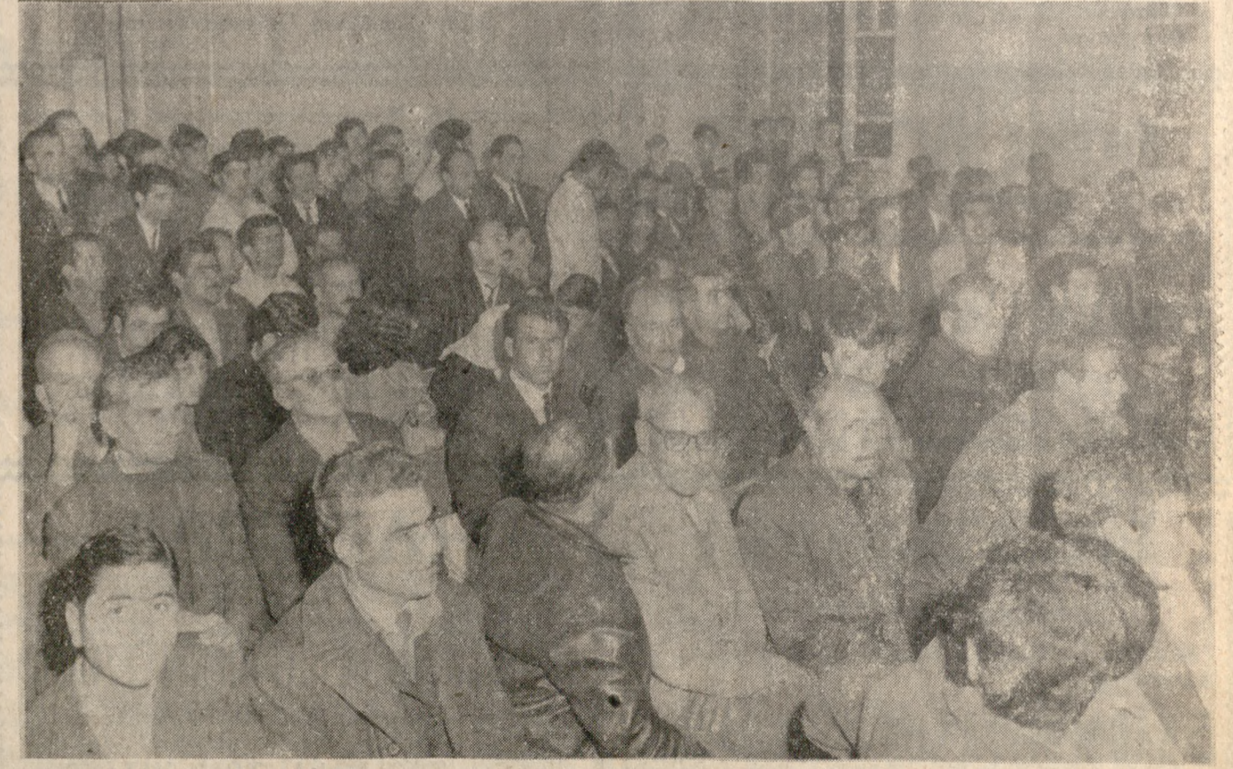
Κατάμεση από κόσμον ή αίθουσα τού δικαστηρίου χθές τό βράδυ, με τήν έναρξιν τής δίκης

των κατηγορουμένων ήμερικανών διά τήν ύπόθεσιν χασίς. Έκ τής εικόνας άποδεικνύεται τό ζων