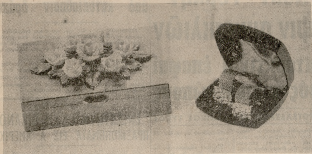
Στό «ΝΤΕΚΟΡ» Δαιδάλου 16