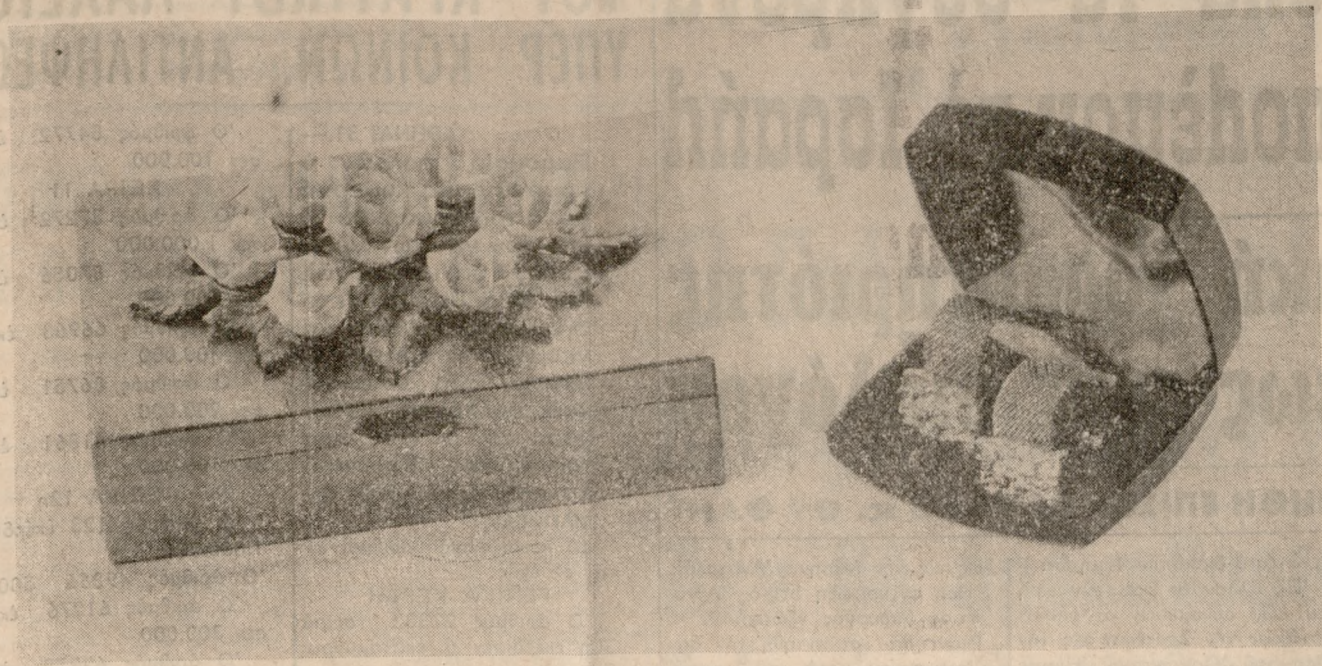
Στό «ΝΤΕΚΟΡ» Δαιδάλου 16