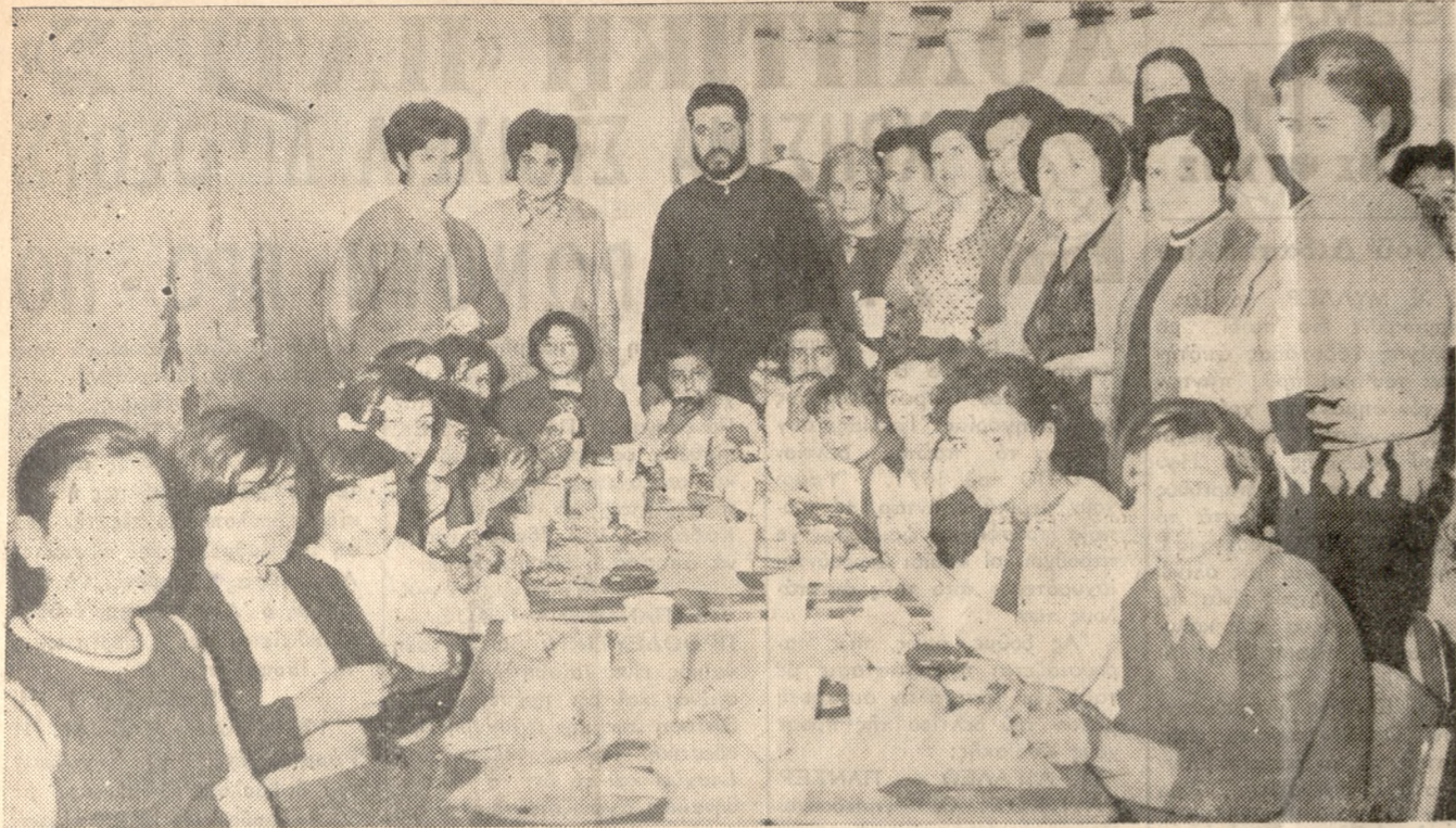
Στιγμιότυπον από την καλώς οργανωμένη παιδική συνεστίαση των Καθηκτικών Σχολείων της ένορίας Φορτέτσας. Κατ' αυτήν παρετέθη γιλούσιον γεύμα υπό της Έκκλησίας, ἐψάλησαν ἐπίκαιρα ᾄσματα καὶ διενεμήθησαν διάφορα παιγνίδια εἰς 85 μαθητὰς τῶν Καθηκτικῶν.