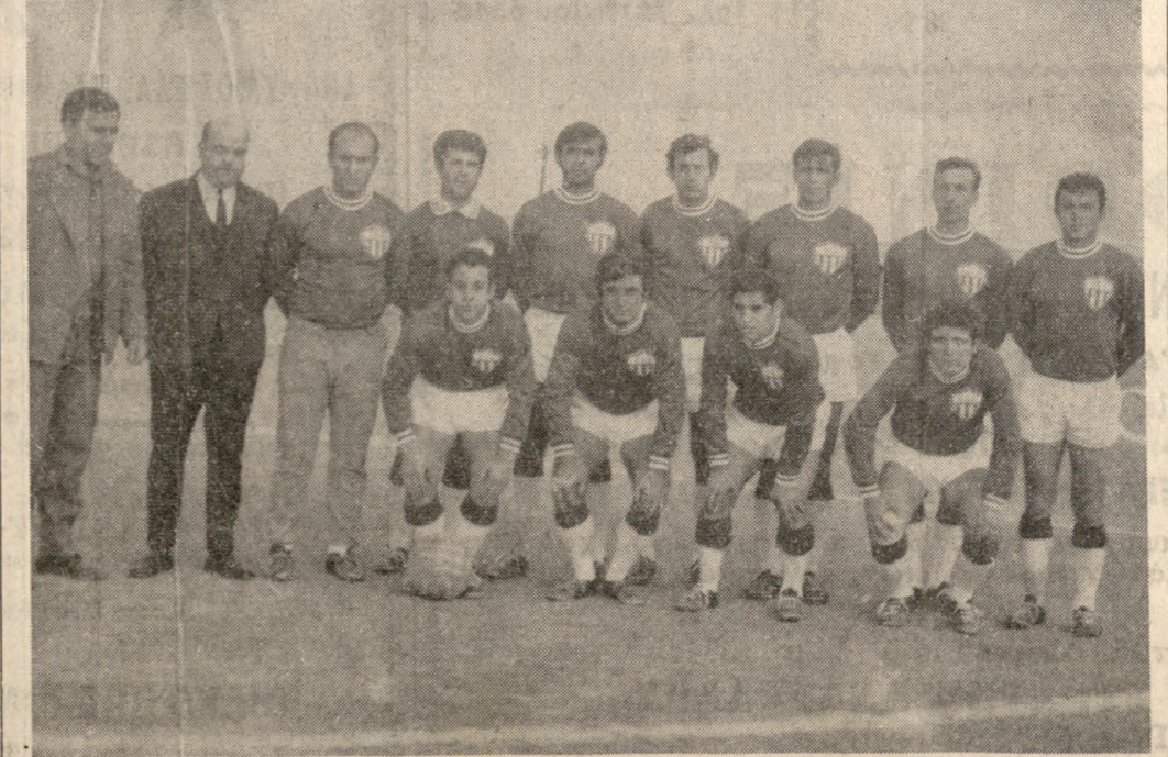
Η ποδοσφαιρική όμάς του ΠΟΑ, ή όποία μετά την νίκη της έπι του 'Ηροδότη κατακτά τόν τίτλο του τοπικού πρωταθλήματος Α' Κατηγορίας.