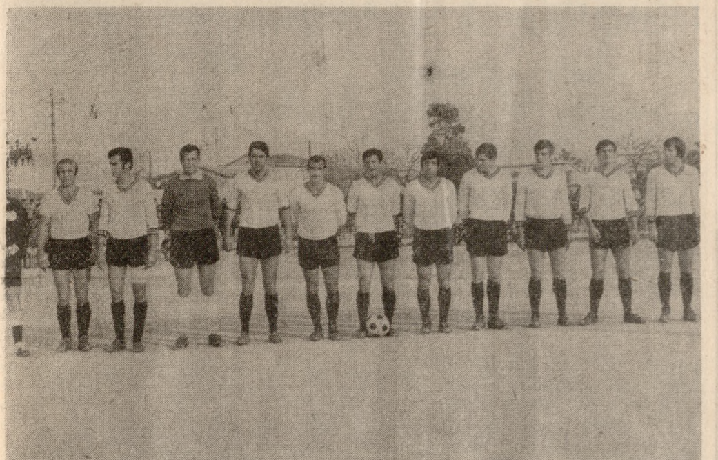
Η ποδοσφαιρική όμάς του ΟΦΗ παρατεταμένη εις τό κέντρον του γηπεδού, όλίγον πρό της έναρξεως του αγώνος.