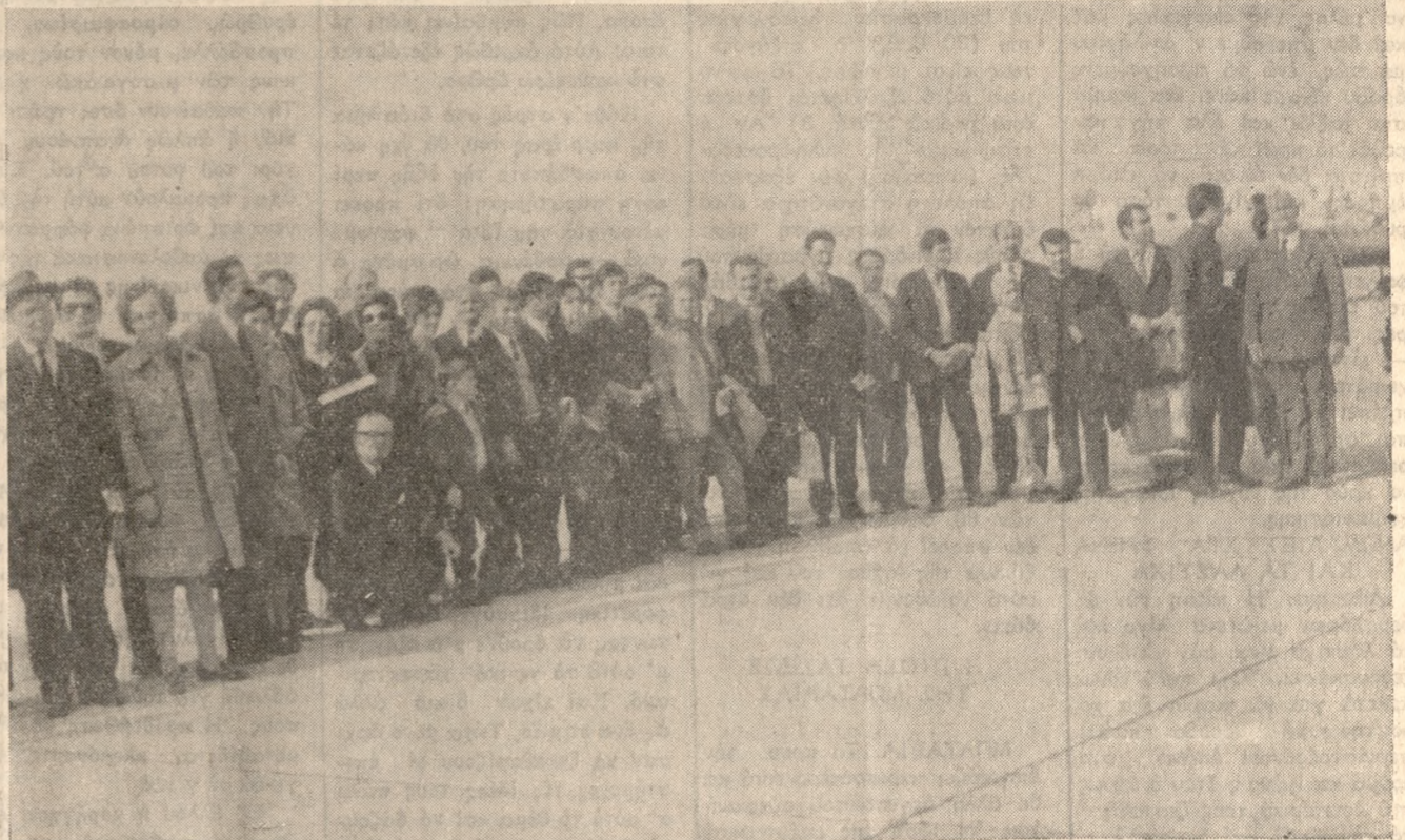
Οι έκδρομείς έξ Ηρακλείου που παραλλήλωσ προς τόν ρόλον των συνοδών του ΟΦΗ στην Κύπρο, εύρον την ευκαιρίαν δι' ένα προσκλήμα στή ιερά κώματα της μαρτυρικής Μεγαλονήσου, που από «νσιό της Άφροδίτης» ο έρωτας και ο αγών της Έλευθερίας την μετέβλεσαν σε σύγχρονον θυμό θυσίας. Η φωτογραφία εις τό άεροδρόμιον της Λευκωσίας.