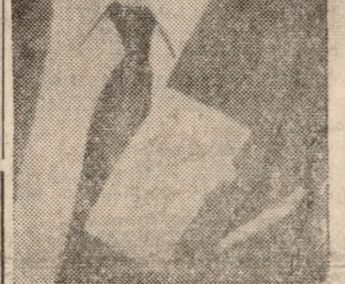
Στόχος άντιπολιτεύσεως καί Στρατού ό πρωθυπουργός Ντεμιρέλ. Έχει άκόμη κάτι να πείη πριν άποφασισθή ή άποπομπή του.

Άνταποκριταί ειδήσεω γραφικών πρακτορείων ένω καί έγι να ειπω κάτι. Μετά τήν συνάντησιν του με τόν κ. Ντεμιρέλ ό στρατός εις τήν Τουρκία αν διά τήν άποπομπήν του πρωθυπουργού Κ. Ντεμιρέλ.