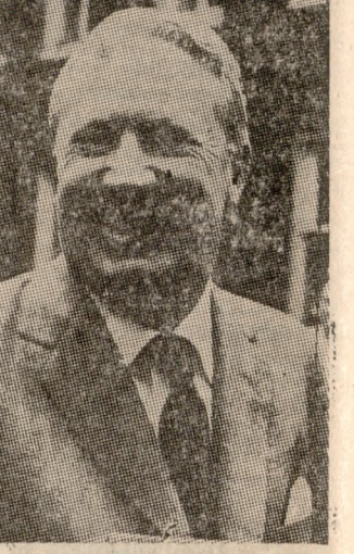
Ο Βρετανός πρωθυπουργός κ. Χήθ, πρώτος Άγγλος πρωθυπουργός...