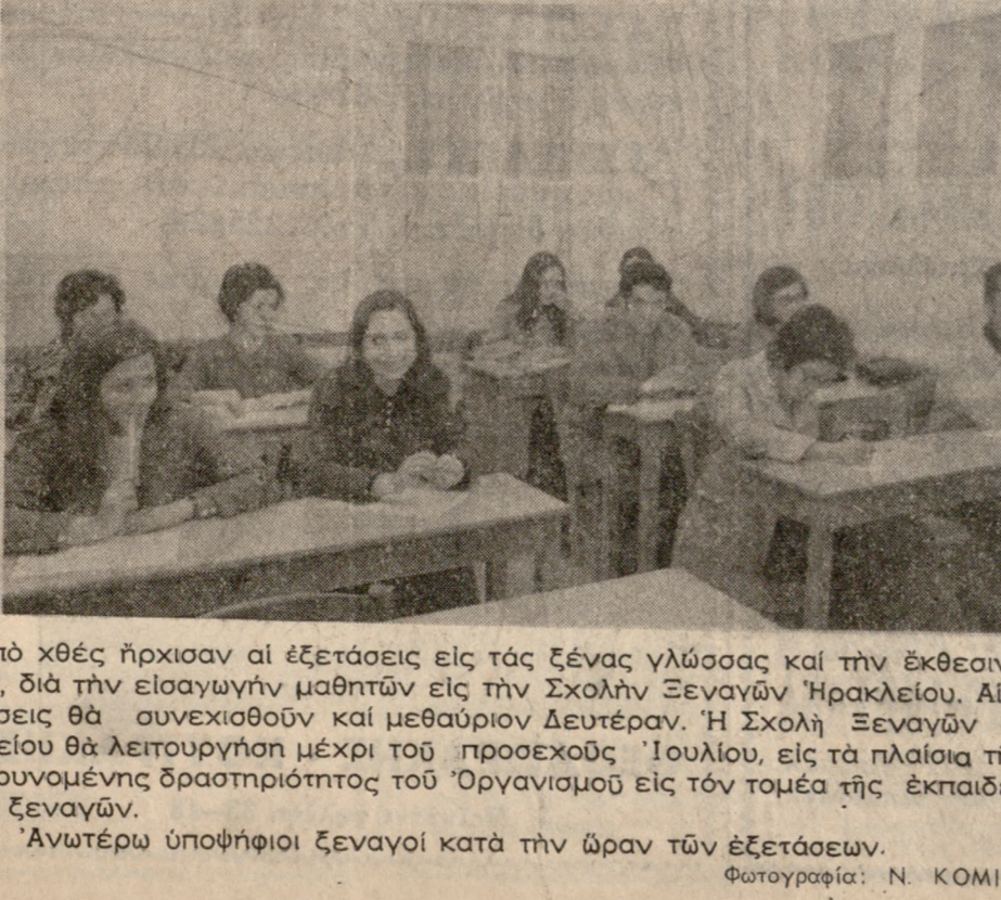
Από χθές ήρχισαν αι εξετάσεις εις τας ξένων γλώσσων και την έκθεσιν ιδεών, διά την εισαγωγήν μαθητών εις την Σχολήν Ξεναγών Ηρακλείου. Αι εξετάσεις θα συνεχισθού και μεθαύριον Δευτέραν. Η Σχολή Ξεναγών Ηρακλείου θα λειτουργήσιν μέχρι του προσεχούς Ιουλίου, εις τ' ά πλαίσια της διεξυνομένης δραστηριότητος του Όργανισμού εις τόν τομέα της εκπαιδεύσεως Ξεναγών. Ανωτέρω υποψήφιοι Ξεναγοί κατά την ώραν των εξετάσεων.