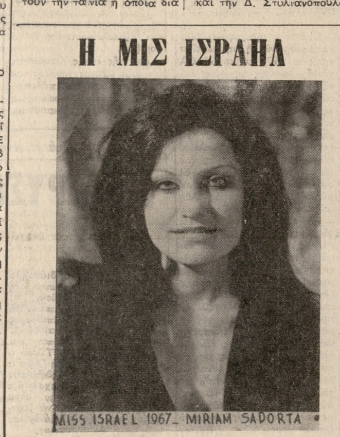
MISS ISRAEL 1967. MIRIAM SAVORTA

Ἡ Μίς Ἰσραήλ ΣΑΠΟΡΤΑ ἡ ὅποια πραγματῶς εἶ μεγάλη τούρντ στὸ χῶρο τῆς Μεσογείου ἀπὸ χθὲς τραγοῦδα Ἑλληνικά καί ἔξανα τραγοῦδα στὴν «ΑΘΗΝΑΙΑ» Ἀγ. Ἰωάννης.