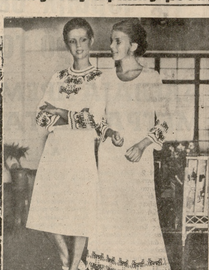
Μίντι καιμάρι φόρεμα: Δύο έντυ πασιτικά μοντέλα τό 1971 από Τρεβιρα κρέμ με έμπριμέ έμπνευσμένο από τό Ούγγαρέζικο φολ - κλόρ.

—'Ανεξάρτητα από τον θόρυβο που έχει δημιουργήσει γύρω από τό μήκος της φασαίας για τό όποιον ούτε οι δημοιουργοί μόδας αλλά ούτε και οι έμπροσθοι του όραίου φύλου έχουν άκόμα κατασταλάξει, ή μόδα εξακολουθεί τήν πορεία της λανθάνοντα άλλες λεπτομέρειες που δίνουν τήν σφραγίδα της έποχής. Η πιο σημαντική, είναι τ' όστύλ φολ-κλόρ με διεθνή άπήχησι και έγκάρδια άποδοχή εκ μέρους των γυναικών. Στις καινούργιες και καλοκαιρινές παρισινές συλλογές έμπριμέ ύφασματα με σχέδια έμπνευσμένα από μοτίβα λαϊκών κεντημάτων διαφόρων χωρών, γίνονται ανασάμπλ γιάτνη πλάϊ, φορέματα για τήν πόλι και θεαματικές βραδείνες τσαντέτες. Γνωστά καταστήματα των 'Αθηνών εισάγουν τελευταία ύφασματα από τό έξωτερικό, θεαματικά, μεταξάτα, τό περισσότερο συνθετικά με έπικρατέστη τήν τρέβιρα όπου είναι τυπωμένα μοτίβα έμπνευσμένα από τήν λαϊκή μας χειροτεχνία. Μεσοβίτικα, κρητικά, σκυριακά, χωρίς να παραληφθούν και τα έμπριμέ που θυμίζουν τής πατροπαράδοτης κορμιελωτές μας κουβέρτες. Έξ άλλου οι Έλληνες δημοιουργοί μόδας δέ παρουσιάζουν στις νέες ανεισιτάκτες και καλοκαιρινές συλλογές τους σημαντικό αριθμό μοντέλων από ύφασματα έμπριμέ με λαϊκά μοτίβα.