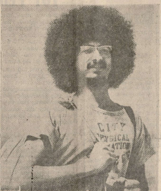
Προσθεῖς στὴν Ἀθήνα, χθες τὸ πρῶτο ὁ Ἡράκλειο, αἴριο, κῆρος αἶδα ποῦ θά περιερίε τὸν μαζοῦ θύσανο τής κόμης του, σὺν σκοταστῆ φανο.