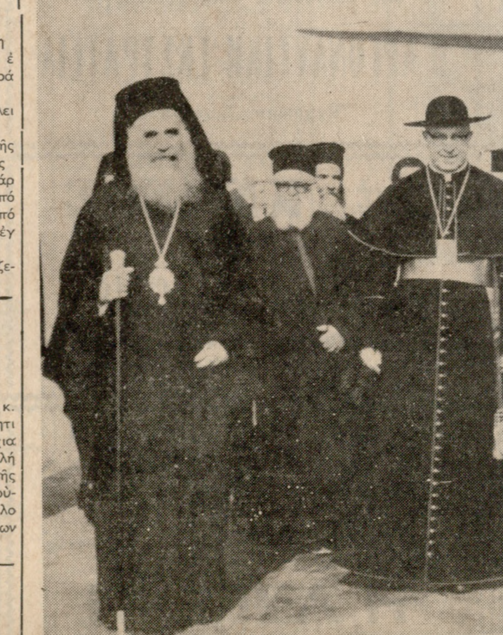
Ο Καρδινάλιος κ. Ιωάννης Βίλλεμπρανς φωτογραφούμενος άμα τής καθόδου του εκ του αεροκάβου τής Όλυμπίτης. Διακρίνονται έπίσης ο Σεβ. Άρχιεπίσκοπος Κρήτης κ. Ευγένιος, ο Σεβ. Μητροπολίτης Πέτρος κ. Δημήτριος, ο Δήμαρχος κ. Βογιατζάκης και ο αιδεσιμώτατος Έλ. Φορτίνο.