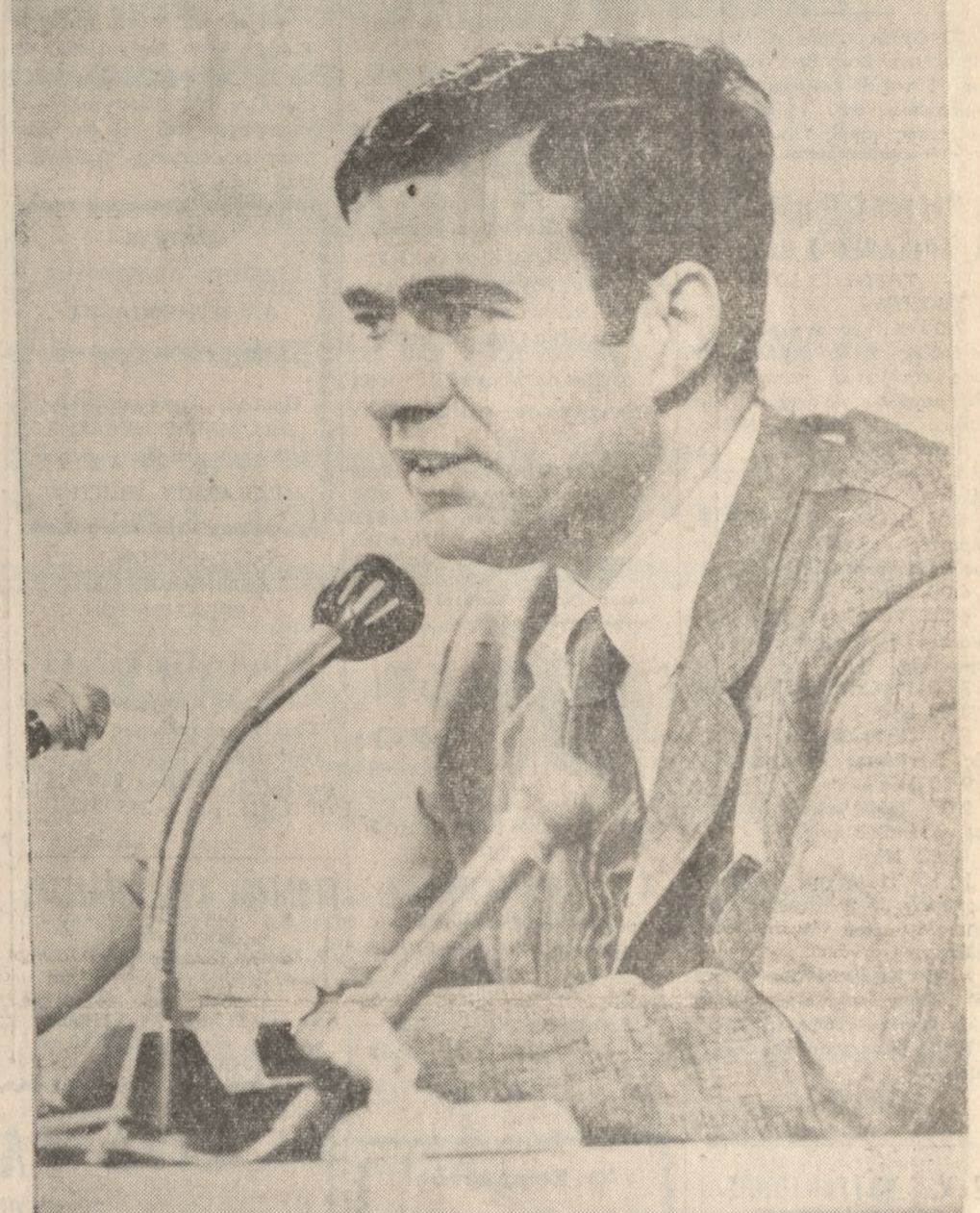
Ο ΑΦΙΧΘΕΙΣ ΧΘΕΣ ΣΤΗΝ ΠΟΛΙΝ ΜΑΣ ΥΦΥΠΟΥΡΓΟΣ ΠΑΡΑ Τῷ ΠΡΩΘΥΠΟΥΡΓῷ κ. ΓΕΩΡΓΙΟΣ ΓΕΩΡΓΑΛΑΣ

κῆρυξεν άμέσως δι’ Αγιον Νικόλαον, όπου οἱ μερον θα όμιλήσῃ πρὸς τόν λαόν με θέμα: “Αι πολιτικά πρόοπτικά τής ‘Επανάστασις”. Έκ τού νομού Λασιθίου ο κ. Γεωργαλάς θα έπιτρέψη αύριον, ένταύθα και τήν 8.30’ έσπερινήν θα όμιλήσῃ, από τό έξώστυ του Νομαρχιακού Καταστήματος πρὸς τόν λαόν του νομού Ηρακλείου με θέμα: “Ο κρικός που δέν έσπασε”. Μετά τήν όμιλίαν του ο κ. Γεωργαλάς θα δώσῃ δεξίωσιν, εις τό ξενοδοχείον “Ατλαντίς” εις τήν όποιαν θα παραστούν αι ‘Αρχαί και έκ πρόσωποι τών παραγωγικών τάξεων και τού Τύπου.