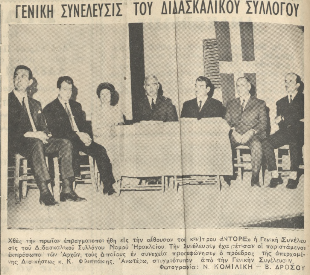
Χθές τήν πρώην έπισημοποιήθη εις τήν αίθουσαν τού κέντρου «ΝΤΟΡΕ» ή Γενική Συνέλευσις του Δ.δασκαλικού Συλλόγου Ηρακλείου.