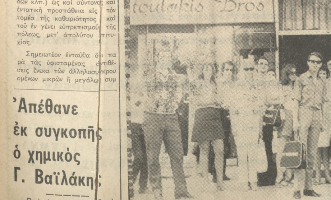
Μετὰ τὸ ἀεροπλάνον Τσάρτερς ἀφίχθησαν χθὲς τὸ ἀπόγευμα εἰς τὴν πόλιν μας, ὅπως εἰχομεν γράψει οἱ 20 πρᾶκτορες τοῦ Τουριστικοῦ Γραφείου τοῦ Λονδίνου («Ὀλυμπικ ΧολιντεΪ») τοῦ ὁποῖου Γ. Διευθυντὴς εἶναι ὁ κ. Βασιλεῖος Μάντζος. Εἰς τὴν φωτογραφίαν, οἱ ἀφίχθητες, εἰς τὸ ξενοδοχεῖον «ΑΣΤΟΡΙΑ» εἰς τὸ ὁποῖον καὶ θὰ καταλοῦσιν.