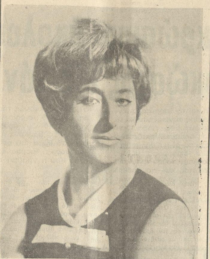
Ἡ διεθνὴσ φημῆσ καθηγήτρια τῆσ Αἰσθητικῆσ δ. ΜΑΙΡΗ ΛΑΜΠΕΛΕΤ.

Ἐφθάσε χθές ἀεροπο ρικῶσ στὴ πόλῃ μας ἡ δι εθνικὴ φημῆσ αἰσθητι κὸσ — καὶ ἄλλοτε σύμ λοντασ εἶσι στὴν ἐπαγ γελματικὴ ἀποκατάστα ση τῶν νέων τῆσ Κρή τησ. Ἀπὸ ἐφέτοσ ὅλα τὰ