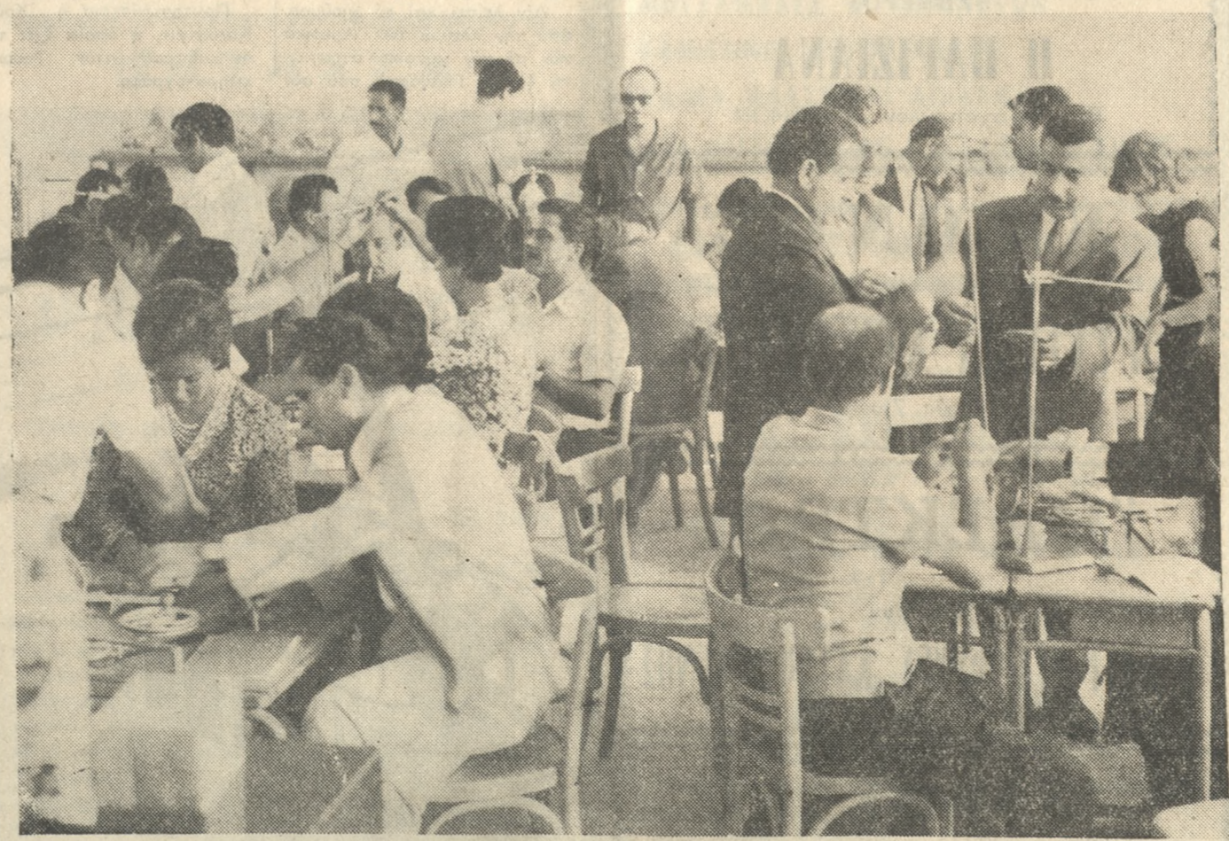
Έγένετο χθές επίσημος έναρξις τής λειτουργίας του Σεμιναρίου τεχν. μετεκπαιδεύσεως των Διδασκάλων τών όποιων επίμκων δά τής παρουσίας των: ο Σεβ) τών Αρχιεπισκόπων Κρήτης, ο κ. Νομάρχης, ο έκπρόσωπος τού κ. Στρ. Δ) τού, ο κ. Δήμαρχος, ο κ.κ. Γεν. Επιθεωρητής Κρήτης και Γεν. Έκπαιδευτικός ο κ. οί κ. (Επιθ) ται Δ. Εκπαιδευτικός. Άνωτέρω οί Διδάσκαλοι, ενώ άκούονται εις τήν κρήσιν των όργάνων Φυσικής και Χημείας τιά όποια έχορρήγουν δωρεάν ή Έθν. Κυβέρνησις δεικνύουσα διά μίαν εισοίτι φεράν τού ζτηρών τής ενδιάφερον διά τήν Παιδείαν.