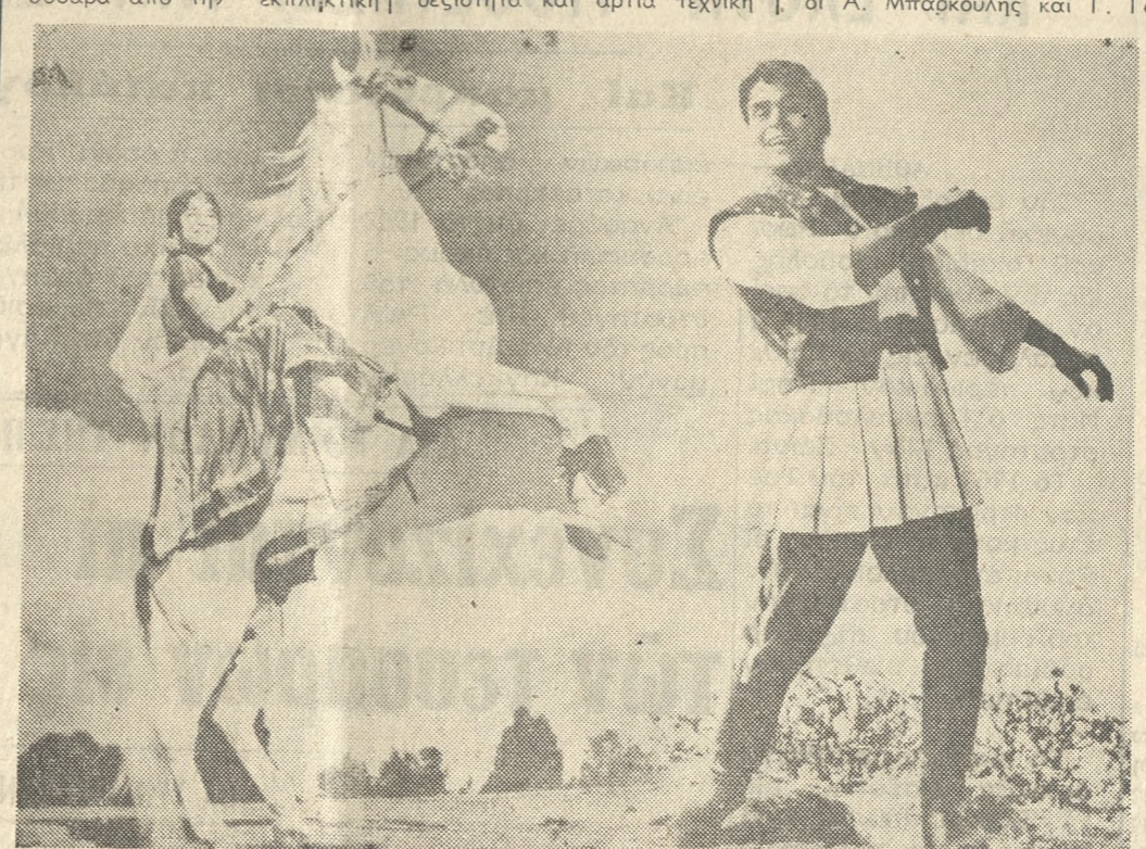
‘Από αριών Σάββατον θα προβάλλεται εις τόν κιν)φον «ΗΡΟΔΟΤΟ» ή ταινία (‘Τό άστέρι τών 'Ινδών») ή όποια είναι σκηνοθετημένη από τόν Τ. Πρακάκι Ράο και στην όποια πρωταγωνιστούν οι άριστείς τού 'Ινδικού κιν) τογράφου.

ΠΑΡΑΣΚΕΥΗ 13.8.71 2.00 Νέα 2.05 'Επικίνδυνες άποστο- λές ερευνίτεται κατασκοπείας 3.05 'Ο παγωμένος κόσμος 'Εις διαφέρων ντοκιμανταίρ 4.00 Νέα 4.05 Μάικ Ντάγκλας Σόου Ποικίλο μουσικό πρόγραμμα 5.30 Μουσικό Ντοκιμανταίρ 6.00 Νέα 6.30 'Η στρατιωτική εκπαί- δεύσις Ντοκιμανταίρ 7.05 'Αίρον Χόρς Γουέ- στερ, επεισόδιον τής σειράς 8.00 Νέα 8.05 Ντόρις Νταϊή Σόου Κωμικόν επεισόδιον 8.30 'Τ' δνομα τού Παιχνι- διού 'Αστυνομία ή επιρρίτεται τής 8 εβδομάδης 10.00 Νέα 10.15 Ντάν Μάρτιν Σόου Μουσικό ποικίλο πρόγραμμα 11.06 'Τό μαγικό κουτί βρα- μωτική κινηματογραφική ται- νία 12.57 Νυκτερινόν δελτίον ει- δήσεων. ΤΕΛΟΣ