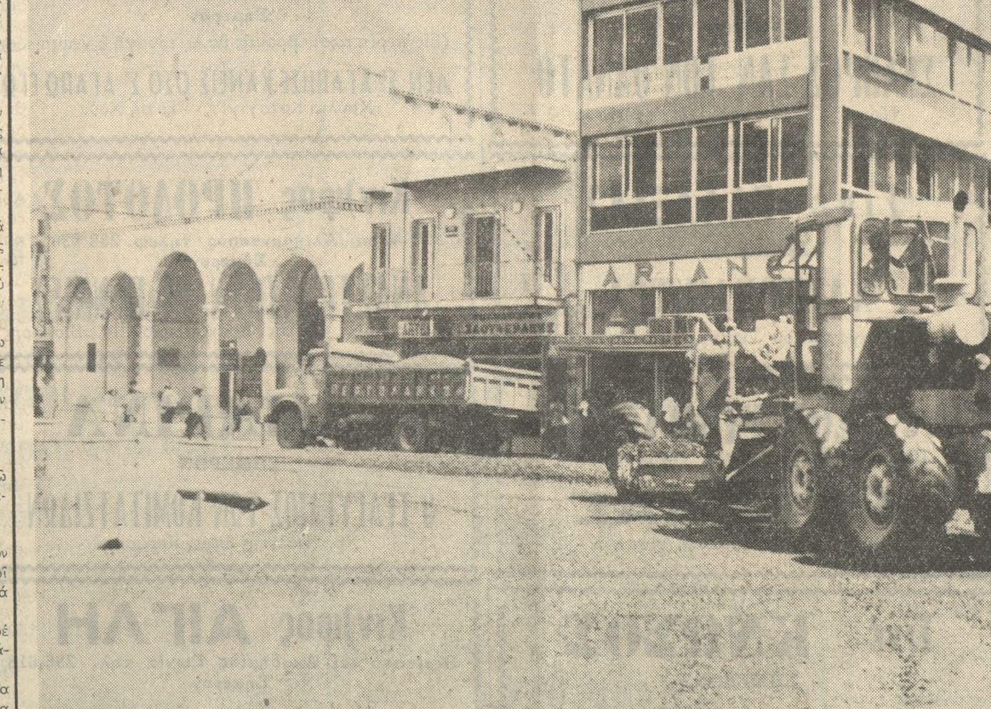
Μάταια άναζητούν χθές ένα τραπέζιν εις τήν πλατείαν Έλ. Βενιζέλου (Συντριβάνι), οι ξένοι τουρισται καί άρκετοί συμπολίται, δι' ένα άναψυκτικόν. Η άπουσία πάντως καθισμάτων ύπέρξεν επί θελημένη άφού ειδικά συνεργεία ήκολούθησαν με τήν ασφαλτόστρωσιν της πλατείας.