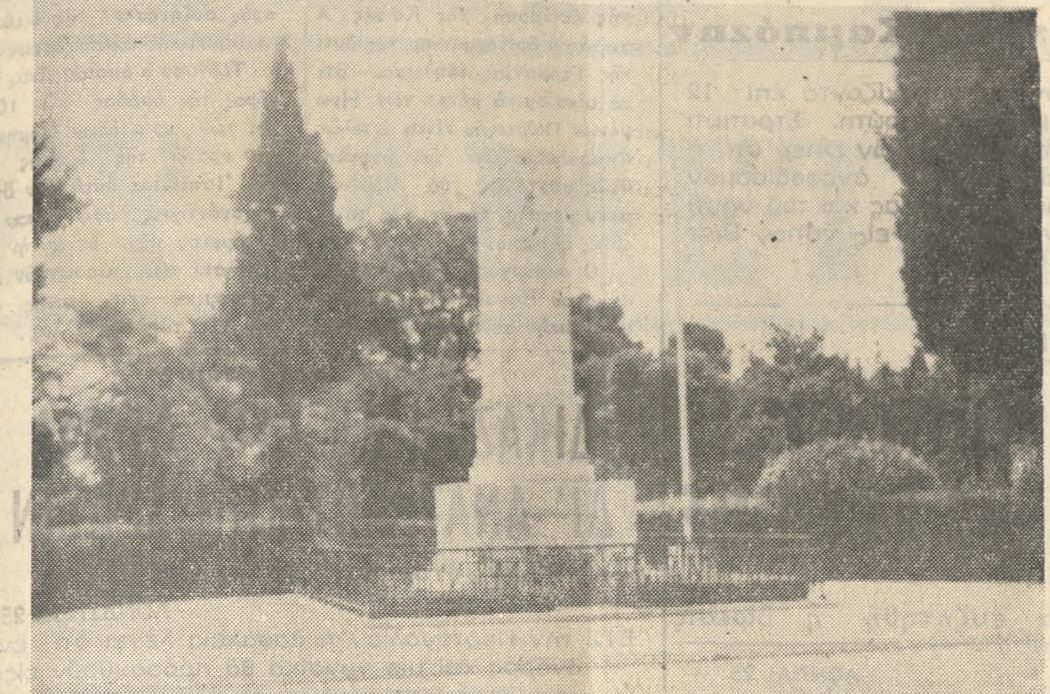
Ο λόφος του Στράνη και τή ιστορικόν μνημείον με τό 'Χαίρε ω χαίρε λευτεριά'.