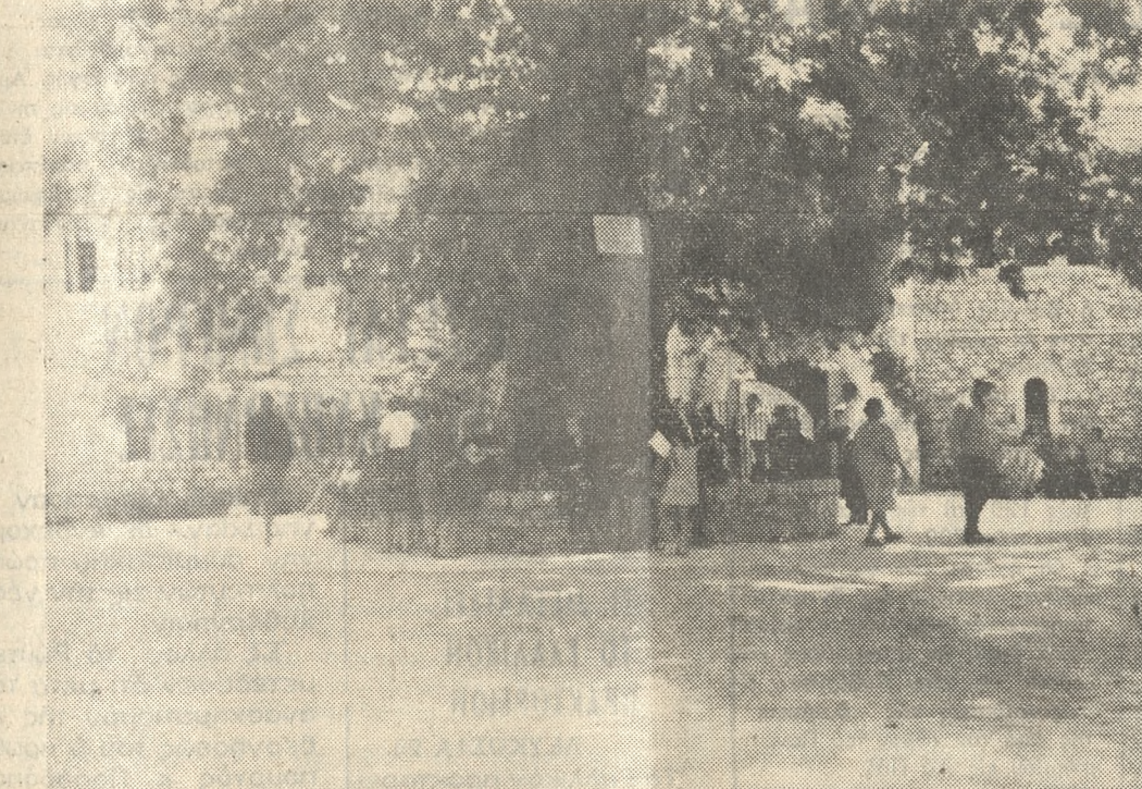
Ο ιστορικός πλάτανος τής Μονής 'Αγ. Λαύρας.