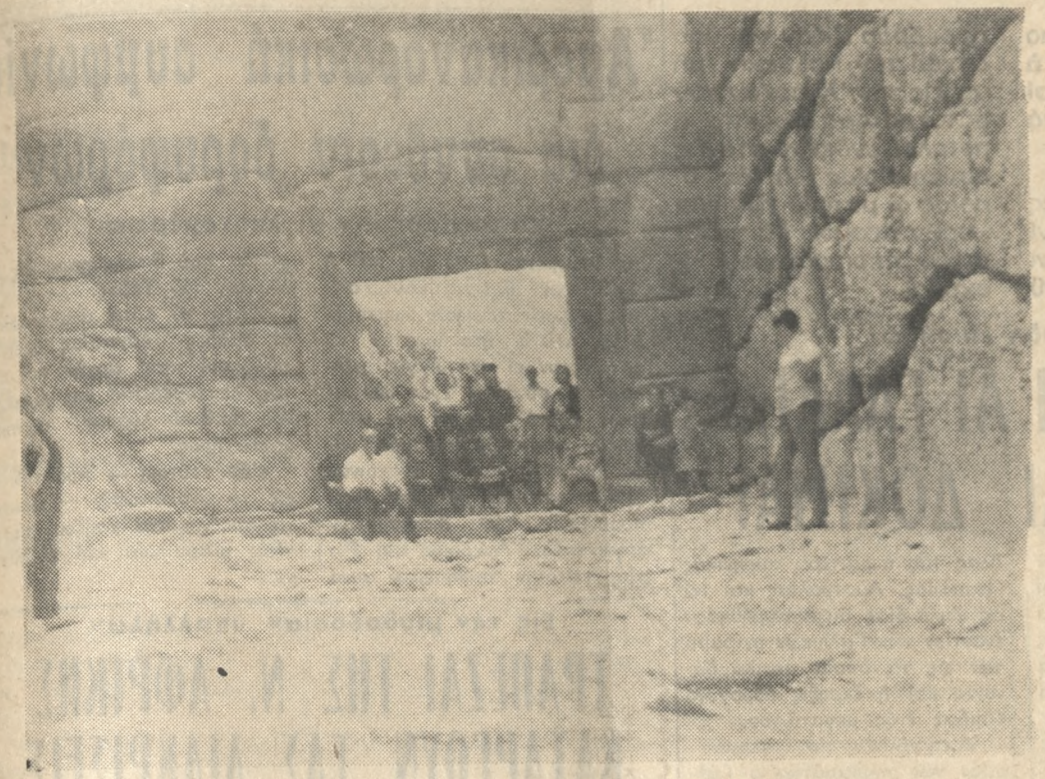
ΣΤΗΝ ΠΥΛΗ ΤΩΝ ΛΕΟΝΤΩΝ

νηροικό ανάμολο δρόμο και θρησκόμα μπροστά στην Πύλη των Λεόντων που πήρε τ' όνομα από δύο ανάγλυφους λέοντες που την στολίζουν. Στα ματά ο νους στη θέα της και βιερωπάται καθώς. Πώς το ποβετήθηκαν εκεί επάνω αυτοί οι όγκοί; Κανείς δεν βρίσκει να μάς λύση την άπορίαν, οι λέοντες μάς βλέπουν τό μυστήριο. Περνούμε τη μεγαλοπρεπή Πύλη. Ένας ανηφορικός δρόμος γεμάτος πέτρες μεγάλες γλιστερές οδηγεί στην κορυφή του λόφου όπου βρίσκονται τ' ερείπια του 'Ανακτόρου. Έκει έζησε ο 'Αγαμέμνωνας, ο γενναίος βασιλιάς, ο αρχηγός του Τρωικού Πολέμου. 'Ερείπια και μόνο έρείπια βρίσκονται στη θέση του μεγαλόπρεπου παλατιού, που ήταν ξεκουστό για τή δόξα, τή πλούτη τή δύναμή του.