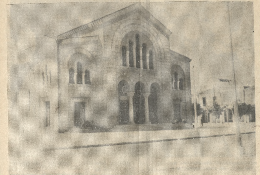
Ο ΝΑΟΣ ΤΟΥ ΑΓ. ΙΩΑΝΝΟΥ ΣΤΟ ΠΡΟΚΟΝΙΟΝ

«Μὴν εἶναι τὰς χάρες τὰ ἔρεπτα (μὲνα ἀρχαῖα μνημεῖα τῆς (χρυσῆ) στολῆς Πού ἡ τέχνη τῆς φέρει κατὰ (καθένα μιά δόξα ἀθάνατη (διαλαλεῖ!» Συνεχίζεται