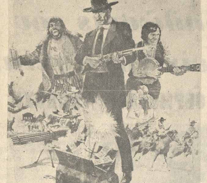
'Ο Λή Βάν Κλήφ όπως έμφ ανιζεται στην ταινία «ΣΑΜΠΑΤΑ», ή όποία προβάλλεται άπό χθές στον Κίνο «ΗΡΟΔΟΤΟ».

Κάθε λογιής ταινίες προσέλωται στους κινηματογράφους μεστήν έβδομάδα αυτή. 'Ετσι ό θεατής δέν δυσκολεύεται νά διαλέξη τό φιλμ τής άρεσκείας του. —'Επιχειρήσις Κωνσταντινουπολις (ΣΤΑΥΡΩΤΗ): 'Εγχρωμη περιπέτεια πρακτώρων 'Ιταλογαλλικής παραγωγής. Πρόκειται για μία από τίς έπιτυχημένις ταινίες πρακτώρων ή όποία παρακολουθείται με έ διάφέρον γιατί ή δράσις τής δέν σταματά ούτε λεπτό. Πολύ καλός είναι ό Χρόστ Μπουόλντς σ' ένα ρόλο Τζάι ημς Μπόντ. Τό φιλμ έχει γυρισθή στην Κωνσταντινουπόλη, πολλά τό πιά τής όποίας ένθουσιάζουν τόν θεατή.