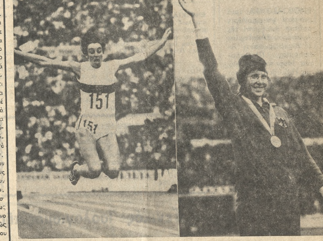
ΕΛΣΙΝΚΙ.— Μεγαλύτερη έπιτυχία από τους άνδρες είναι οι γυναίκες της Δυτικής Γερμανίας στους πανευρωπαϊκούς άγώνες στίβου του "Έλσινκι" της Φιλανδίας. Στήν έθνική της Φιλανδίας. Στήν έθνική τά δύο χρυσά κορίτσια ή "Ινγκριτ Μικέλε — Μτέκερ (άριστερά, πρώτη στο άμμα εις μήκος με 6,76 μ.) και ή Χάιντε Ρόζελαντ (δεξιά — νικητρια τουτέινάθλου με 5,299 μ.) Στυλοβάτου με 4Χ400 μ. (3,02, 9). ΜΕ 5 χρυσά, 7 άργυρά και 5 χαλκά μετάλλια, ή "Όρσπώνος Δημοκρατία της Γερμανίας κατέλαβε την τρίτη θέση μετά την Λαϊκή Δημοκρατία της Γερμανίας που πήρε την πρώτη και την Σοβιετική "Ένωσι (τρίτη θέση).