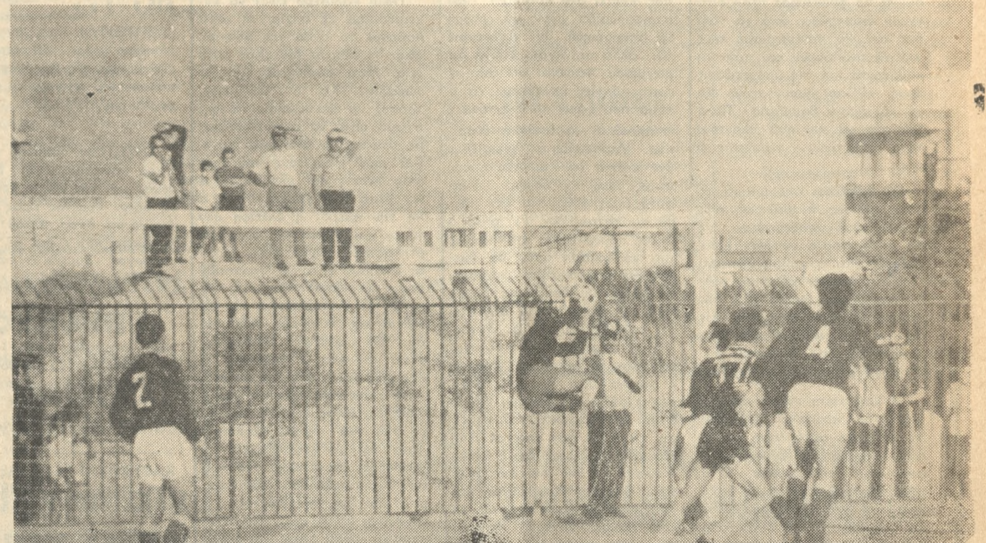
‘Ο Ιδιαίτερος διακριθής προχθές Ν. Καρνής άποκρούει με θεαματικό τρόπο ν την μπάλλα, ύποστηρίζό μενος από τον Γεωργίου.

Α ή Μικαϊκή προηγήθη δύο φορές εις τό σκορ άλλα τελικά Ισοφαρισή από τον ΟΦΙ. Τά τέρματα έπέτυχον κατά σειράν οι Σπαβαράκης (35'), Φρονιμάκης (60'), Πίτσος (70' με πέναλτυ) και Νικολαΐδης (75'